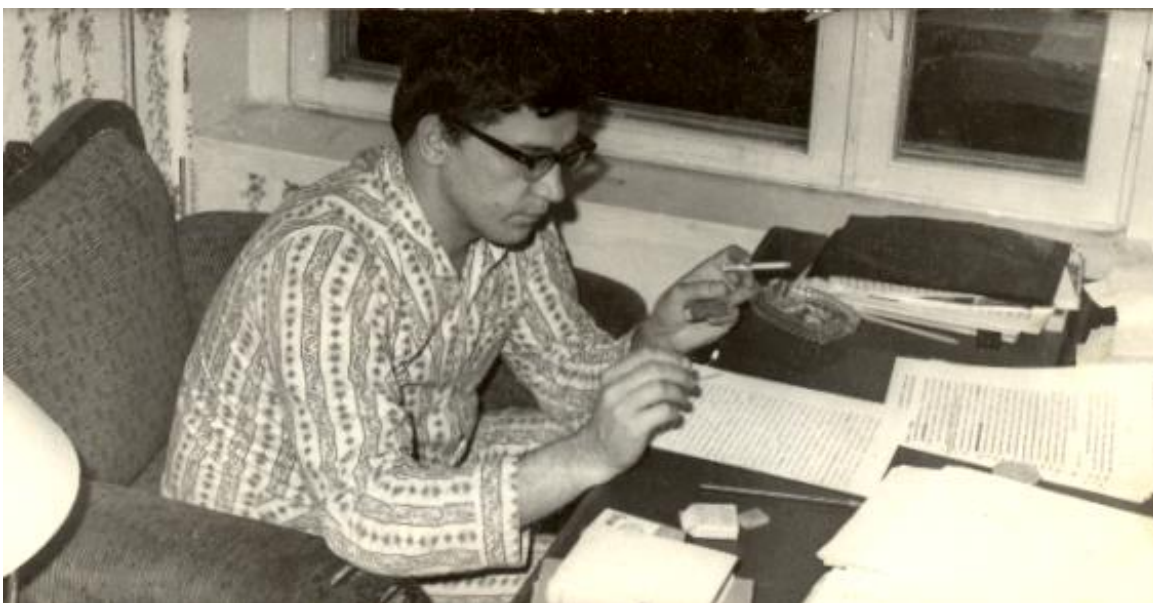
Фото: Э. Иодковский правит роман «Марсианка бродит по Арбату», Старое шоссе, 1972 г.

Однако, если говорить о реалистической поэзии, то все-таки она тоже должна создаваться личной биографией. Биография накаляет строку. Моя жизнь сложилась так, что мне выпало почти 13 лет скитаний по Москве без собственного угла. После того, как я написал «Едем мы, друзья» и уехал на Алтай, я потерял московскую прописку. Тогда я не придавал никакого значения этому факту, но прошло 13 лет, пока я не обрел свою нынешнюю квартиру на Старом шоссе. Об этом — стихотворение «Монолог Кавалерова».