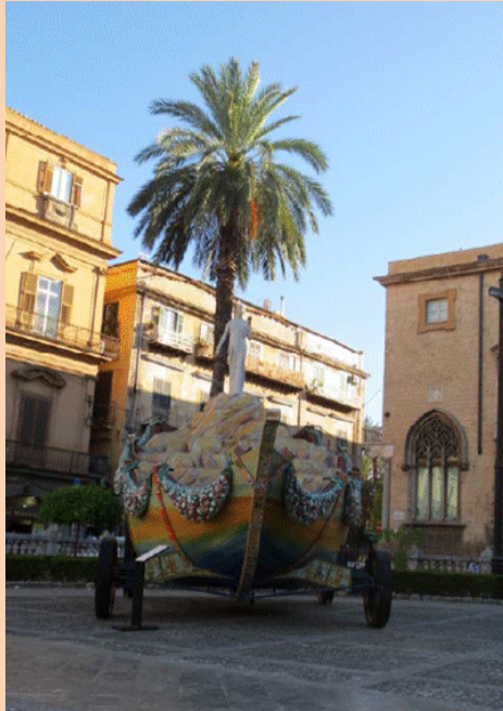
Ο πλωτήρας και το άγαλμα της Αγίας Ροζαλίας του Salvatore Rizzuti, μπροστά από τον καθεδρικό ναό του Παλέρμο.