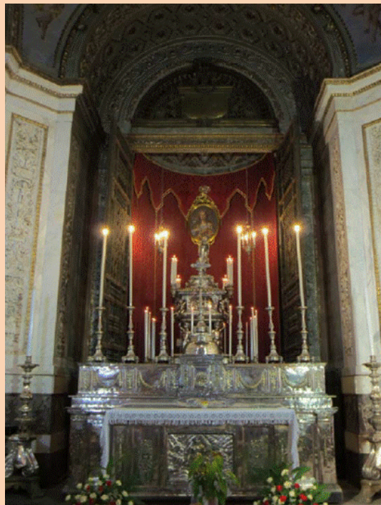
Τα λείψανα της Αγίας Ροζαλίας στον καθεδρικό ναό.