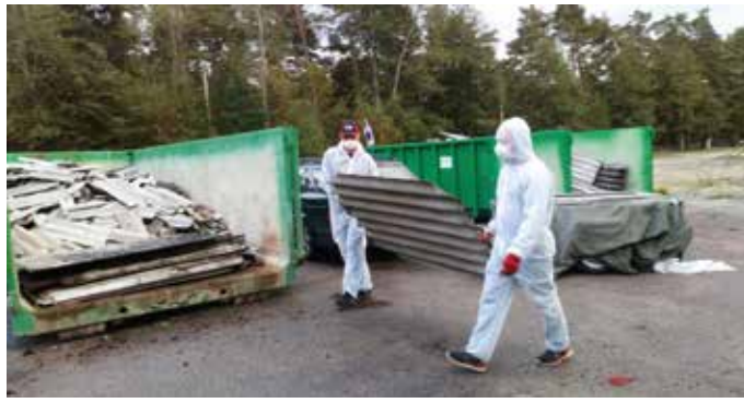
Eterniidi laadimine Kloogarannas.

Siinkohal tänab vallavalitsus eterniidi tootjaid, kes eterniidi väga korrektselt konteineritesse ladustasid, et ka teistel oleks mugav konteinerit kasutada, säästes ühtlasi konteineri ruumi. Samuti kasutati