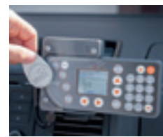
MobilZeit System T4 / k.A.