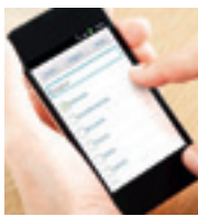
fasttime / 3.0.5