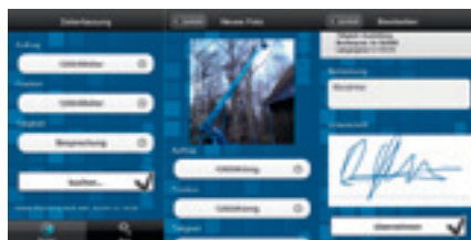
Neben Arbeitszeiten und Pausen werden auch Material-, Auftrags- und Projektdaten erfasst, teilweise auch Fotos und Unterschriften (Digi Zeiterfassung)

>> biles Zeiterfassungssystem in einem Kleinbetrieb. Umgekehrt weiß das Unternehmen, wo seine Mitarbeiter sind und kann sie bei Bedarf an mehreren Baustellen zeit- und wegeoptimiert einsetzen. Zu den weiteren Vorteilen zählen Controlling-Funktionen: Schon am folgenden Tag ist bei Bedarf die Kostensituation eines Projekts auswertbar. Auf diese Weise erhält man einen tagesaktuellen Überblick, wieviel Zeit für ein Projekt aufgewandt wurde und wie groß die Abweichungen gegenüber der Kalkulation sind. Damit gewinnt man auch in der Vorkalkulation eine größere Sicherheit, da die kalkulierten Zeitwerte aufgrund präziser Daten sich den tatsächlichen Werten stetig annähern. Auch für die Lohnbuchhaltung bricht eine „neue Zeitrechnung“ an: Liegen dank digitaler Technik alle erforderlichen Arbeitsnachweise zeitnah vor, ist eine termingerechte und korrekte Lohnabrechnung, respektive schnellere Rechnungslegung möglich. Auch komplexe Zulagen- und Provisionsberechnungen im Rahmen einer Prämienentlohnung werden damit einfacher. Unterschiedliche Tarifverträge oder individuelle Arbeitszeitmodelle können ebenso berücksichtigt werden. Wöchentliche Ausdrücke der erfassten Zeiten steigern das Mitarbeitervertrauen und die Lohntransparenz.