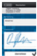
DIGI-WebApp / k.A.

eine zeitnahe Rechnungsstellung und macht ein wirksames Projekt- und Unternehmenscontrolling unmöglich. Demgegenüber haben „digitale Stundenzettel“ gleich mehrere Vorteile: Die Erfassung ist automatisiert, Zeit- und Tätigkeitsnachweise erfolgen zeitnah, nachvollziehbar und präzise, Fehler bei der Lohnabrechnung werden minimiert, Zeiten und Kosten gespart. Dazu werden am Smartphone, Tablet-PC oder einem speziellen Erfassungsgerät Arbeitszeiten, Tätigkeiten und andere Daten nach einem vordefinierten Schema abgefragt. Die erfassten Daten werden entweder zeitversetzt im Büro per Docking-Station eingelesen, per SMS vom Einsatzort versandt oder über eine mobile Internetver-