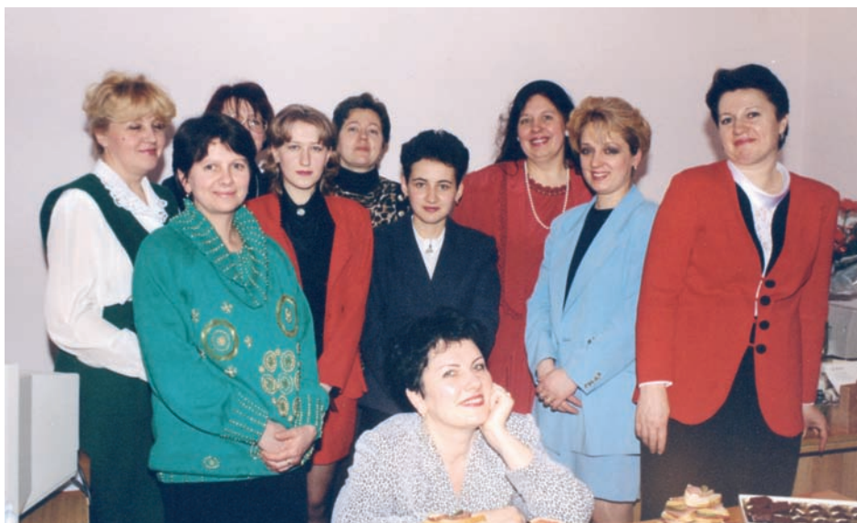
Колектив управління документального забезпечення. 1998 рік

Глибоко усвідомлюючи свою особисту відповідальність та важливість поставлених завдань перед управлінням, працівники всіх його підрозділів постійно вдосконалюють свій фаховий рівень, передусім розширюючи практику взаємозамінності на всіх ділянках роботи з метою забезпечення безперебійного функціонування управління на належному рівні.