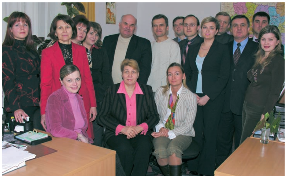
Згуртований колектив 2006 року

Як відомо, Центральна виборча комісія здійснює контроль за діяльністю та консультативно-методичне забезпечення виборчих комісій, які утворюються для організації підготовки та проведення місцевих виборів. Значне місце у цій сфері належить управлінню, адже саме на нього покладаються повноваження щодо забез-