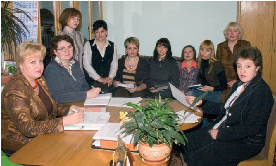
Виробнича нарада: підбиття підсумків, складання планів

ства та контролю чисельністю 48 штатних одиниць, до його складу увійшли чотири підрозділи: протокольний відділ, що мав у своєму підпорядкуванні сектор літературного редагування, контрольний відділ, відділ службової кореспонденції та архівного діловодства, відділ комп'ютерного набору та копіювання. Проте з мотивів організаційної діяльності у лютому 2005 року скорочено чисельність управління до 26 штатних одиниць і відновлено стару його назву.