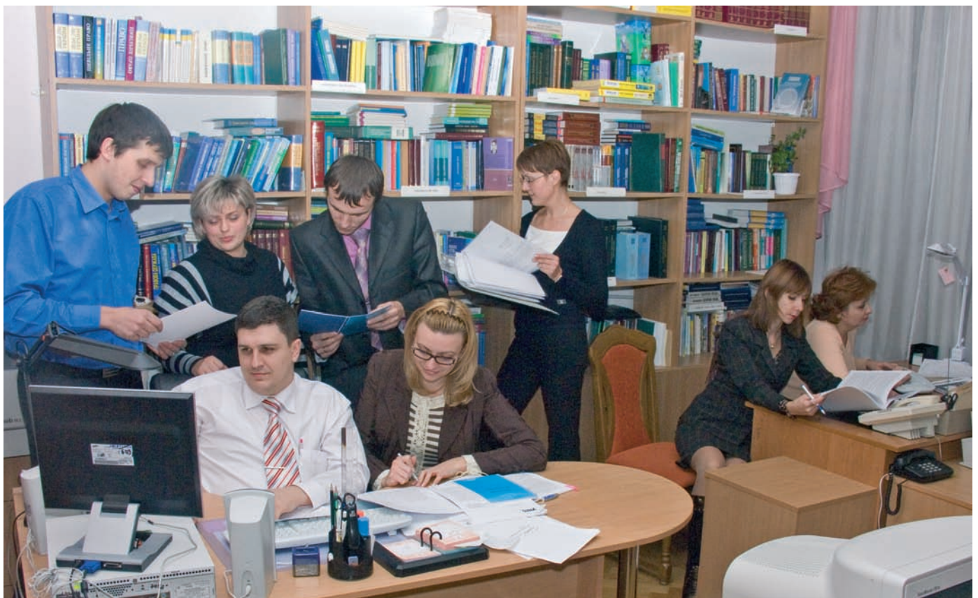
Період виборів – гаряча пора

Роботу юридичного управління Секретаріату Комісії у виборчій кампанії 2006 року було оцінено керівництвом Центральної виборчої комісії – фахівців управління нагороджено Почесними грамотами та Подяками Центральної виборчої комісії.