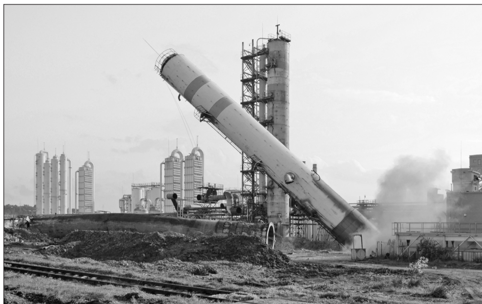
38-metrowe chłodniki przewrócono za pomocą ładunków wybuchowych. Na zdjęciu upadający chłodnik nr 1, za nim płuczka benzolowa i obiekty nowej instalacji oczyszczania gazu.

W sobotę, 30 września, przewrócono wysokie na około 38 metrów chłodniki końcowe gazu nr 1 i nr 2. Zadaniem chłodników było obniżenie temperatury gazu koksowniczego, co pozwalało na