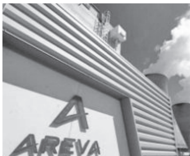
圖一：法國政府注入 45 億歐元資金挽救核能業界龍頭企業 AREVA

這些重整政策在支持者與反對者之間，爆發大量的理論爭論與政治角力，連國際貨幣基金 (IMF) 與美國的許多主流經濟學家也捲入其中。支持重整政策的德國與歐洲「北方」國家認為，財政紀律本就是歐盟「穩定暨成長協定」(Stability and Growth Pact) 的關鍵要素，新的財政重整政策不過是其延續與更新，而許多國家支所以陷入主權債務危機，正是因為長期忽