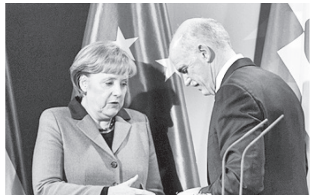
圖三：梅克爾讚揚希臘債務危機所走之艱難路線