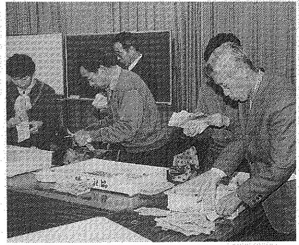
集められた歳末助け合い袋を開封する役員ら

みなさんの理解と協力を得て昨年の12月に行われた「歳末助け合い運動」では約1万2000世帯から468万2573円のお金が寄せられました。この市民らの暖かい善意の浄財は市内の福祉施設や生活困窮者に贈られ、新年を迎える資金の一部として役立てられました。