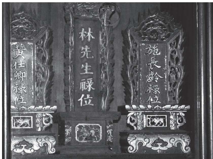
林先生廟供奉三位對開築八堡圳有卓越貢獻之先賢（西元2005年3月吉日）。