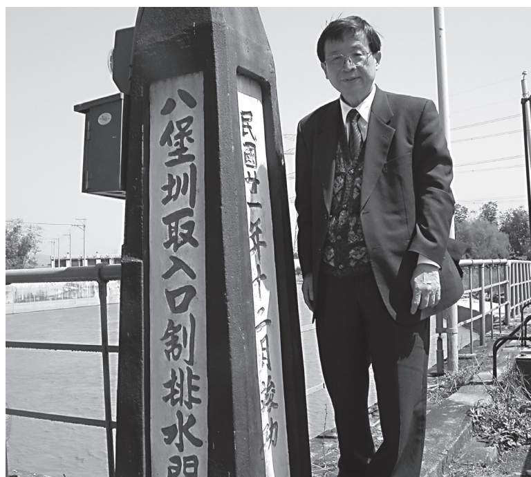
位於彰化縣二水鄉倡和村龍仔頭之「八堡圳取入口制排水門」係建設於西元1932年（日治昭和7年，民國21年，壬申）12月，正式竣工啟用（立者為筆者，西元2005年3月吉日）。