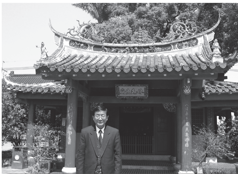
林先生廟宏偉景觀造型，屬重檐歇山式建築，紅色柱子陪襯出鮮飾屋宇。（西元2005年3月吉日）。

林先生廟四週環境清幽，殿宇屬重檐歇式建築，殿內中央供奉林先生祿位，左右配祀施長齡、黃士卿之祿位；謝副總統東閔於臺灣省政府主席任內應允撥款修建。同時，於西元1977年（民國66年、丁巳）6月竣工，使廟宇煥然一新，特頒「德澤流芳」匾，以彰顯其豐功偉業。有關西元1977年「林先生廟重修記」碑，樹立於廟前庭園中；但原「八堡圳之碑」已不見跡，令人百思不解。廟內柱上對聯及碑文內涵，詳如所載。