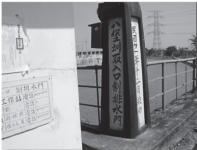
八堡圳取水口位於彰化縣二水鄉倡和村龍仔頭，係建於，西元1932年（日治昭和7年、民國21年、壬申）12月竣工啟用（西元2005年3月吉日，蕭敏修攝）。