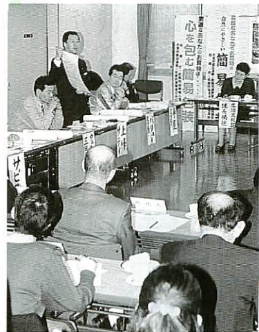
鳥栖市では登録推進店舗を増やすのも課題の1つ

簡易包装を定着させるにはどうしたらいいか。二月三日、県生活文化課が「自然にやさしい簡易包装地区別推進会議」を中央公民館で開きました。会議には、市町村や商工会の職員、スーパー店長、消費者グループの代表ら約三十人が出席。行政、事業者、消費者の三者がそれぞれの立場で意見交換を行いました。 消費者団体の代表から「お店では『簡易包装で』と頼むように何かにつけて言っている