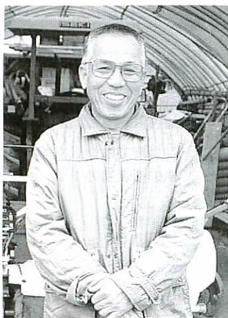
「採算のとれる農業を」と執行さん

「子ども劇場の魅力は優れた生の舞台が見れることと、お母さん同士、子ども同士のつながりができることです」 しかし、十年前に千人いた会員は現在約四百人に減少。収入の大半は会員の月千円の会費で、例会の回数を減らさず、どうやり繰りするかが頭痛のたね。会館の使用料や劇団への公演料・宿泊費と出費は少なくありません。