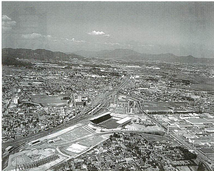
スポーツ文化の定着には長い年月と苦勞が…