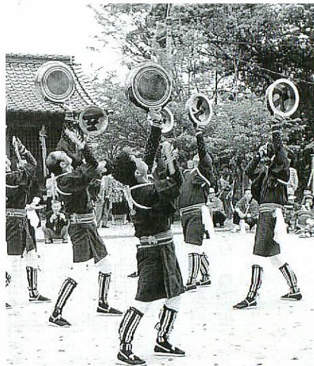
鉦浮立を披露する宿町のみなさん