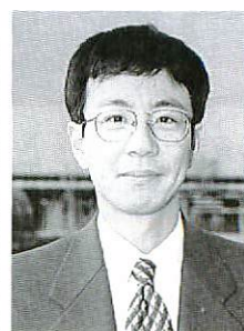
④総務部総務課防災係

防災係では、地域防災計画などの策定や、市内に点在する格納庫、防火水槽、消火栓など消防施設・設備の維持管理、チラシなどによる防災に対する啓蒙活動、消防団に関する事務をはじめ、消防署・警察署などと連携した防災訓練の実施など市民のみならずの生命と財産を守るための幅広い仕事を担当しています。