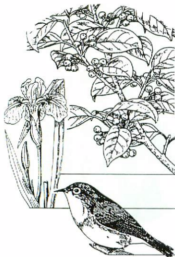
市の木もちのき (クワガネモチ)