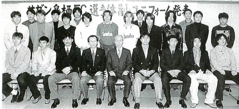
勢ぞろいした「サガン鳥栖」の選手、スタッフ（2/16鳥栖スタジアムで）

さらに、プロサッカーホームタウン誘致鳥栖委員会の有志は一月五日「解散の危機を我々の手で救いたい」という市民の声に応え、チームの運営資金援助を目的とした「鳥