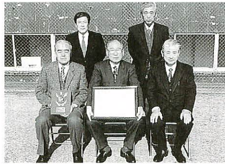
羽立会長(前列中央)ほか連盟のみなさん

連盟の活動は活発で、主に全チームが参加する春季・夏季大会をはじめ、メンバーの年齢の合計を四百歳以上に限定したオールド大会、地域住民を対象とした親善町区対抗大会、中学生の少年野球大会など年間十数回の大会を主催。このほか審判