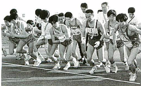
一斉にスタートする各チーム