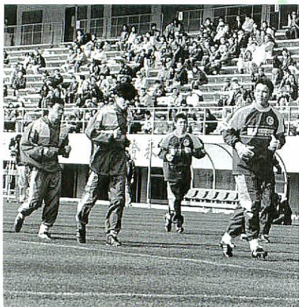
一步一步芝の感触を確かめながら練習する選手たち