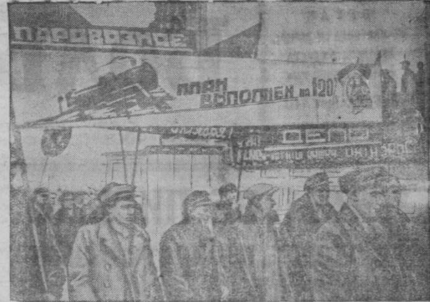
Участники демонстрации в Сталинске проходят мимо трибуны на площади.

Празднование XX годовщины Октября за границей