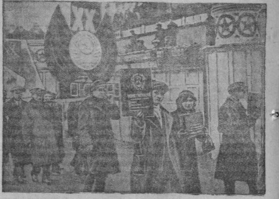
Участники демонстрации в Сталинске проходят мимо трибуны на площади

Злые карикатуры приповожают к позорному столбу пытающихся взорвать мир — фашистов и их презренных лакеев — троцкистов, бухаринцев и других. — Беролись шпион! — продрофе-