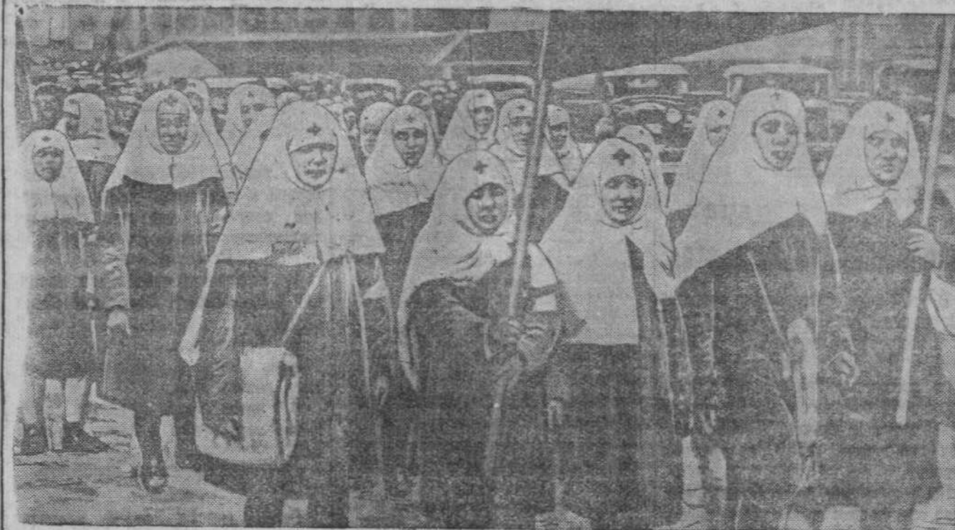
Празднование в Сталинске XX годовщины Великой Октябрьской социалистической революции. На снимке: колонна кружковцев „Красного креста“ 17-й средней школы.