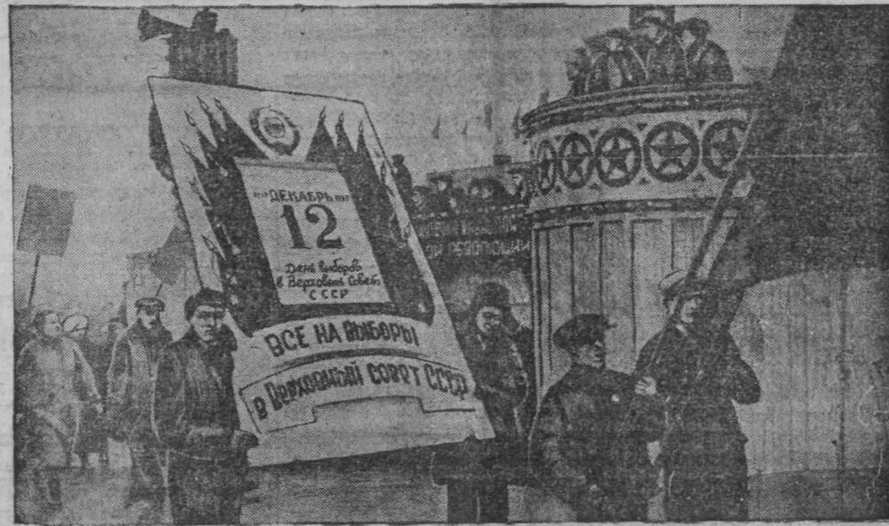
Празднование в Сталинске 20-й годовщины Октября. На снимке: демонстрация проходит мимо трибуны.

7 ноября, в день XX-й годовщины Великой социалистической революции, миллионные массы трудящихся Советского Союза демонстрировали свою безграничную любовь к социалистической родине, свою горячую преданность большевистской партии, великому вождю народов товарищу Сталину