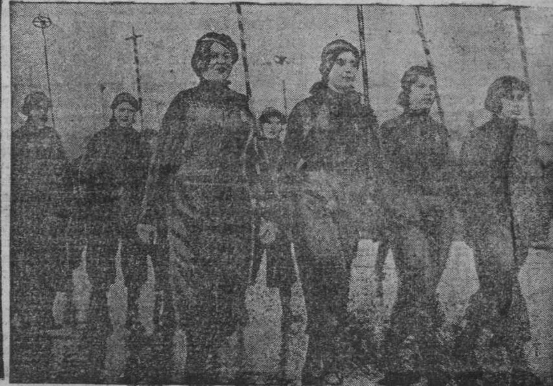
Десятки тысяч трудящихся Сталинска приняли участие в демонстрации. На снимке: участники демонстрации на площади Побед.