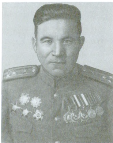
Гв. полковник С. Х. Хабиров, командир 101-го ОКАД (декабрь 1942 г. — май 1943 г.); коман- дир 148-го гв. артминполка (1943 — 1945 гг.)