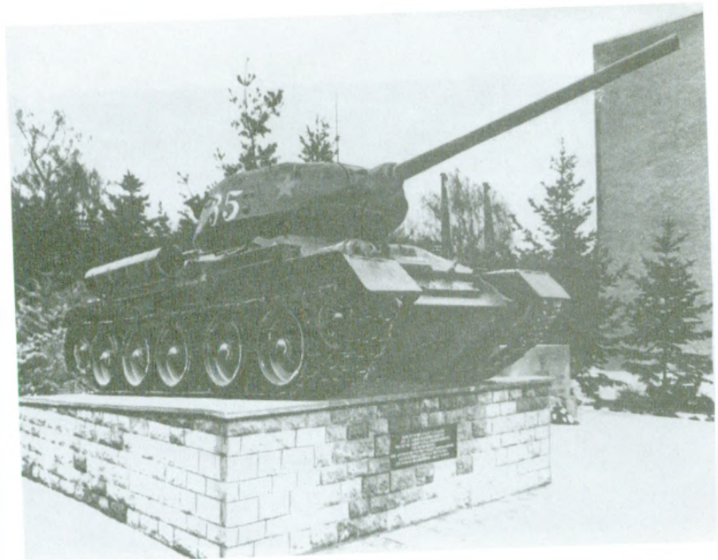
Памятник воинам 62-го гв. кавполка и 32-го танкового полка дивизии.