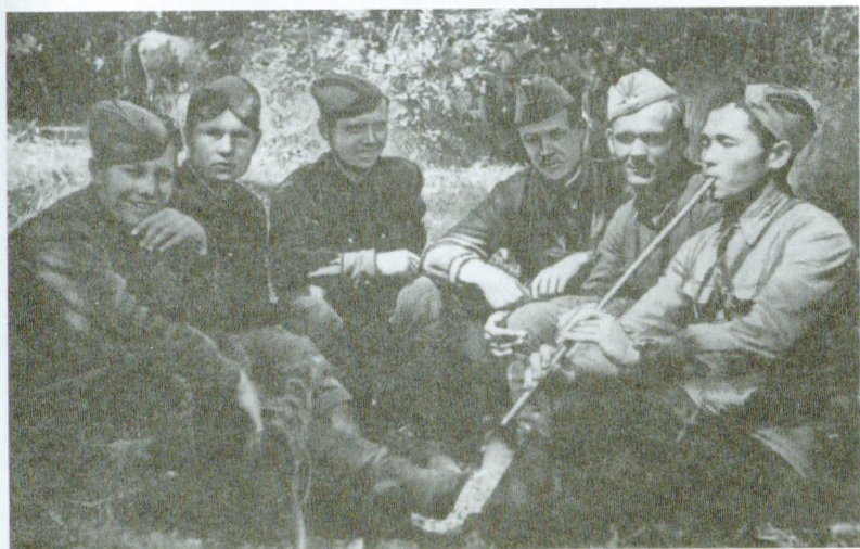
На отдыхе между боями. Брянский фронт