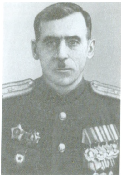
Гв. подполковник Г. Е. Фонде- ранцев, командир 294-го (60-го гв.) кавполка (декабрь 1942 г. — 1943 г.)