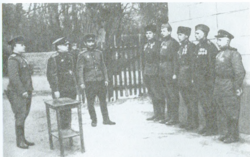
Вручение наград (1943 г.)