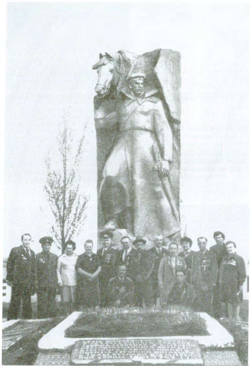
Мемориал, посвященный героическому рейду дивизии (и корпуса) на Донбассе в феврале 1943 г. Сооружен в поселке Чернухино Ворошиловградской (ныне Луганской) области Украины.