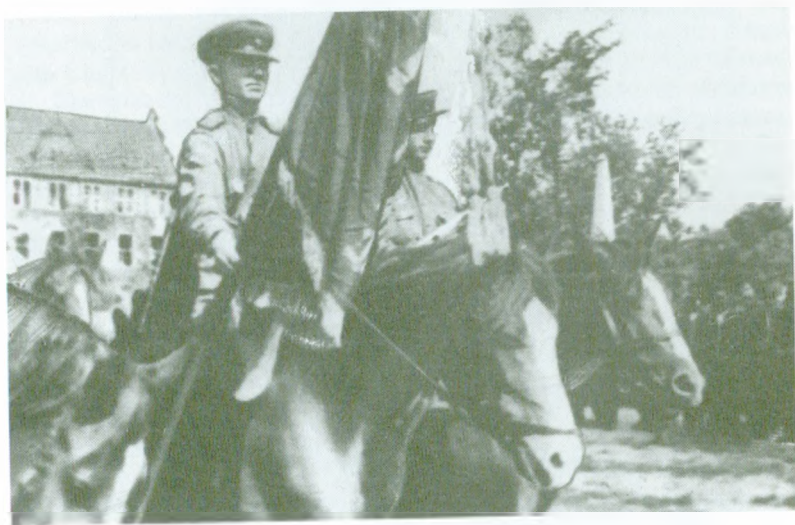
Возвращение с победой