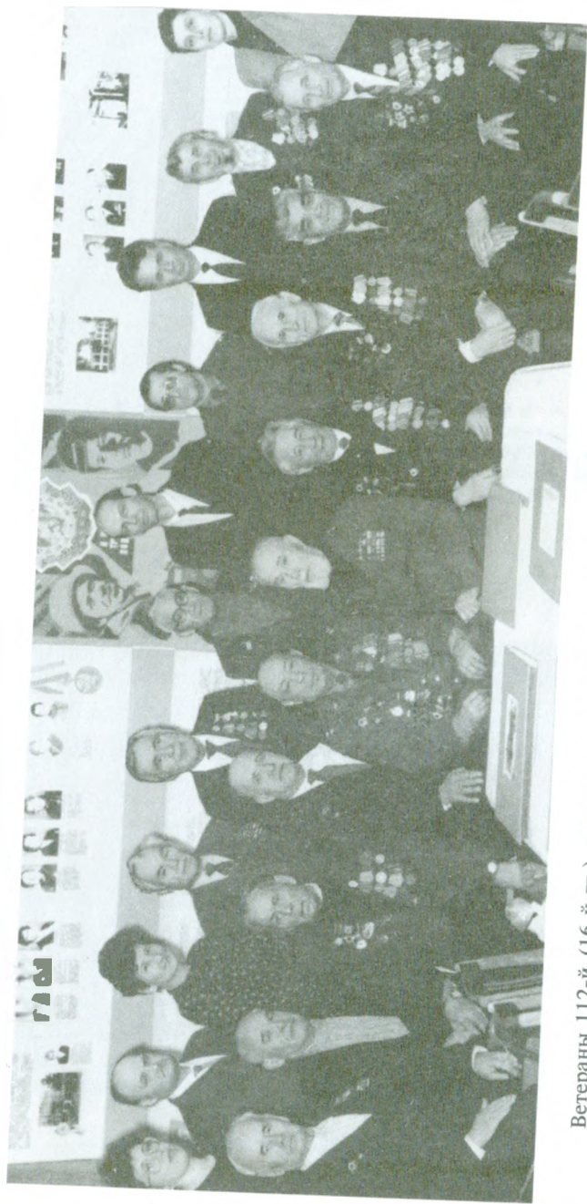
Ветераны 112-й (16-й гв.) кавдивизии в музее боевой славы в средней школе-лицее № 107 г. Уфы