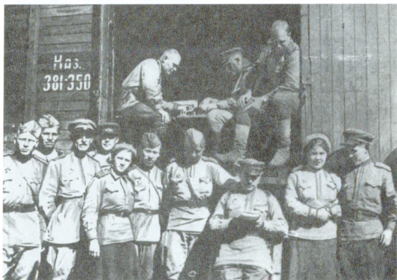
В пути следования на фронт