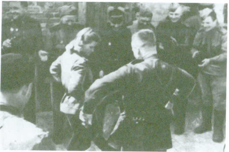
В День Победы