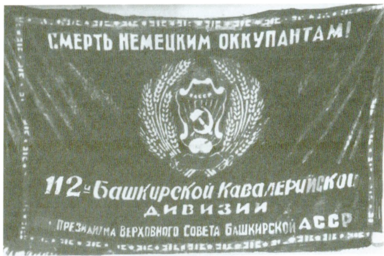
Знамя, врученное дивизии перед отправкой на фронт