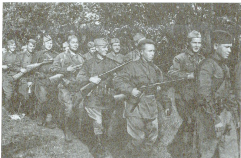
Группа разведчиков направляется на задание. Брянский фронт. Август 1942 г.