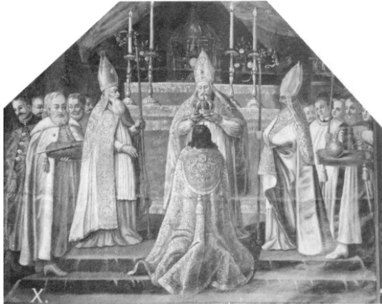
Рис. 1. Коронация Яна Казимира. Миниатюра. 1649 г. Staniatki near Cracow

а пары Церкви – по левую, что в конечном итоге демонстрирует их полномочия как более очевидные и одновременно подчеркивают мирской статус монарха 1 . Вавельская церемония вновь настаивает на большей теизации потестарных полномочий монарха, выводя коронацию как сугубо священническую prerogative.