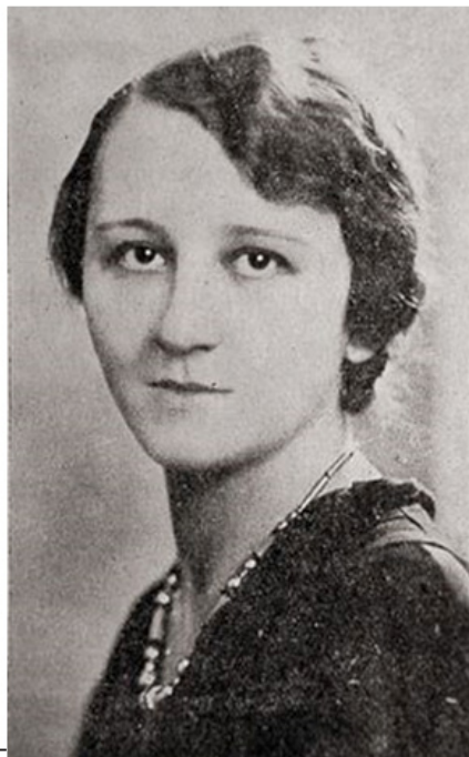
Лидия Винничук. Фотография 1930-х гг.