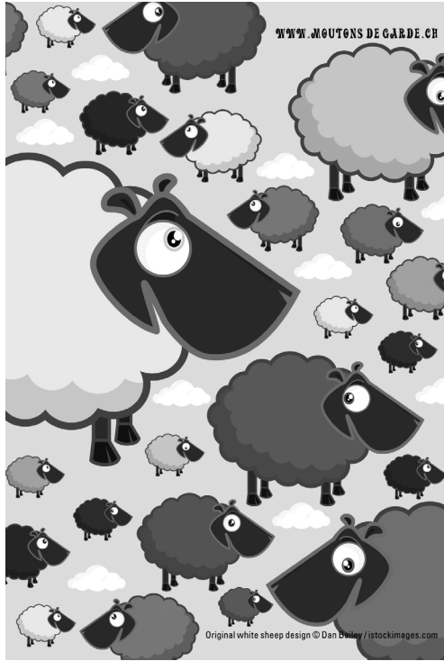
Abbildungen 3 und 4: Motiv des Vereins Moutons de Garde und Emblem des Festes gegen Rassismus