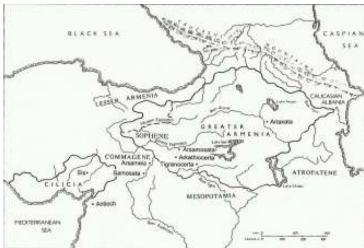
Քարտէս 1. Ծոփքի եւ Կոմմագենէի հայ թագաւորութիւնը 3

Երբ Երուանդունիները վերականգնած են իրենց անկախութիւնը, Ծոփքը կրկրին մաս կազմած է Մեծ Հայքին: Տեղին է յիշել, որ միացեալ Ծոփքի եւ Կոմմագենէի բնիկ ժողովուրդը հայեր էին, իրենց լեզուն՝ հայերէնը: