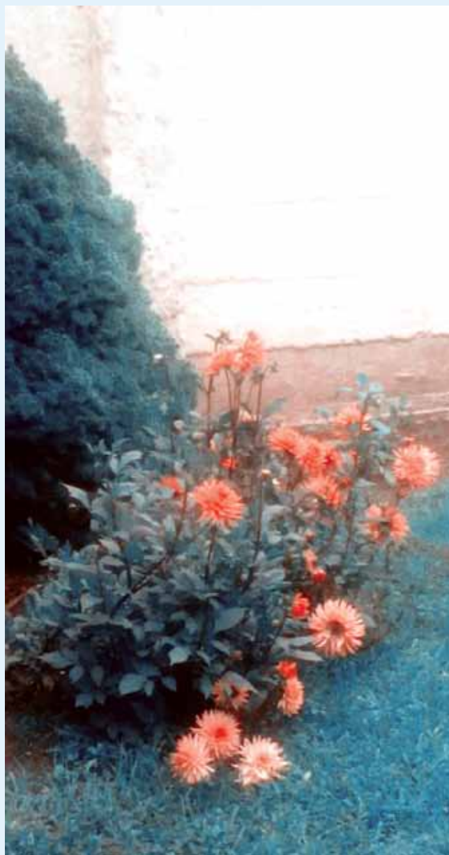
Almássy Lehel: Szeptemberi kert

egy nagyobb testű állat, pont ez jutott eszembe, gyomorterhelő megpróbáltatás egy magyar disznótoron, vérrel együtt eltűnik.