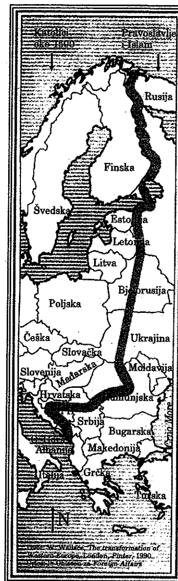
Istočne granice zapadne civilizacije, S. Huntington: Sukob civilizacija (1997), str. 199

Tužiteljstvu nije bilo od interesa utvrditi činjenično stanje o autorstvu karte na Tuđmanovoj salveti. Citirali smo odgovore predsjednika Tuđmana koji su objavljeni u nizu stranih medija. Strategijski atlas (Editions Complexe, 1994.) nalazi se u mnogim