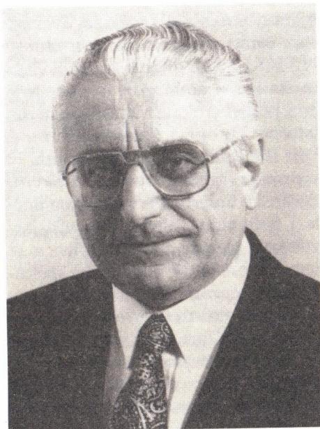
Dr. Franjo Tuđman

sporazumom, gdje je došlo do ideje i do programa stvaranja muslimansko-hrvatske federacije s konfederalnim osloncem na Hrvatsku, što samo po sebi onda u svim tim međunarodnim prijedlozima, do ovoga američkog sada, predstavlja kako bi se u okviru Unije Bosne i Hercegovine srpski dio mogao isto tako osloniti na Srbiju, odnosno Jugoslaviju.