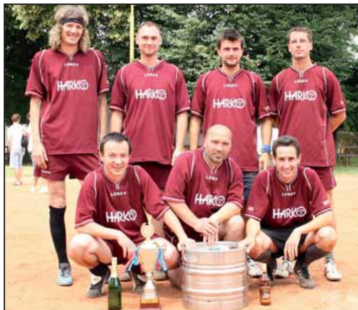
Vítězné družstvo Harko.