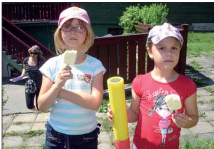
Bobři na Valašce.