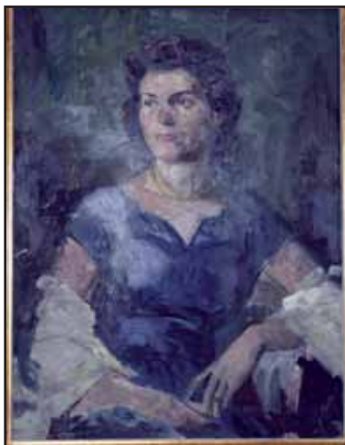
Portrét paní Věry. Autor M. Krasický Foto: R. Nelešovská.

Marcel hodně obrazů rozdával, a tím se jeho obrazy staly na čas neprodejné. Jsem ráda, že mám tady v bytě několik jeho obrazů a že nemám takovou nouzi, abych je musela zpeněžit.