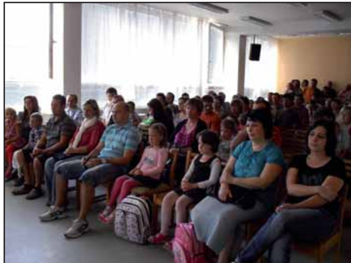
Zahájení školního roku 2011/2012.