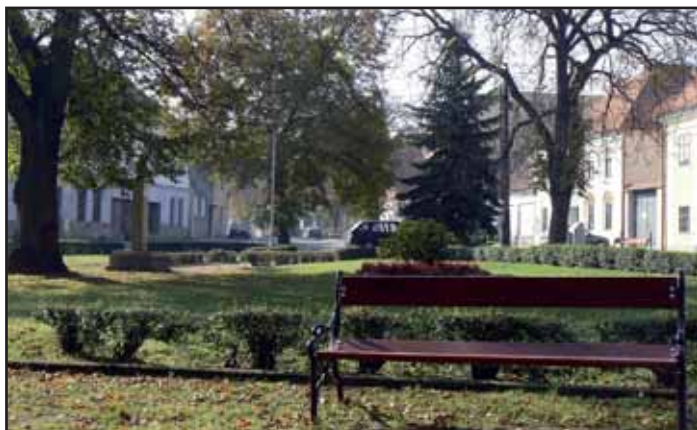
Náměstí A. Dohnala na podzim 2010.