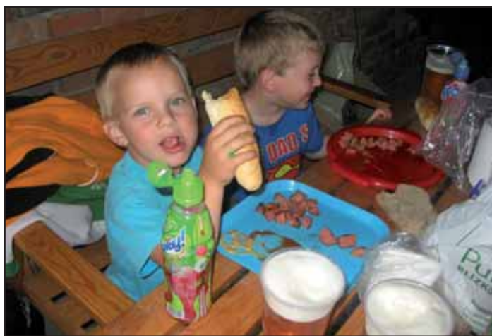
Dětský den v Kalíšku.