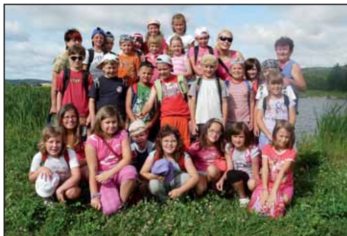
Dětem se na táboře líbilo.