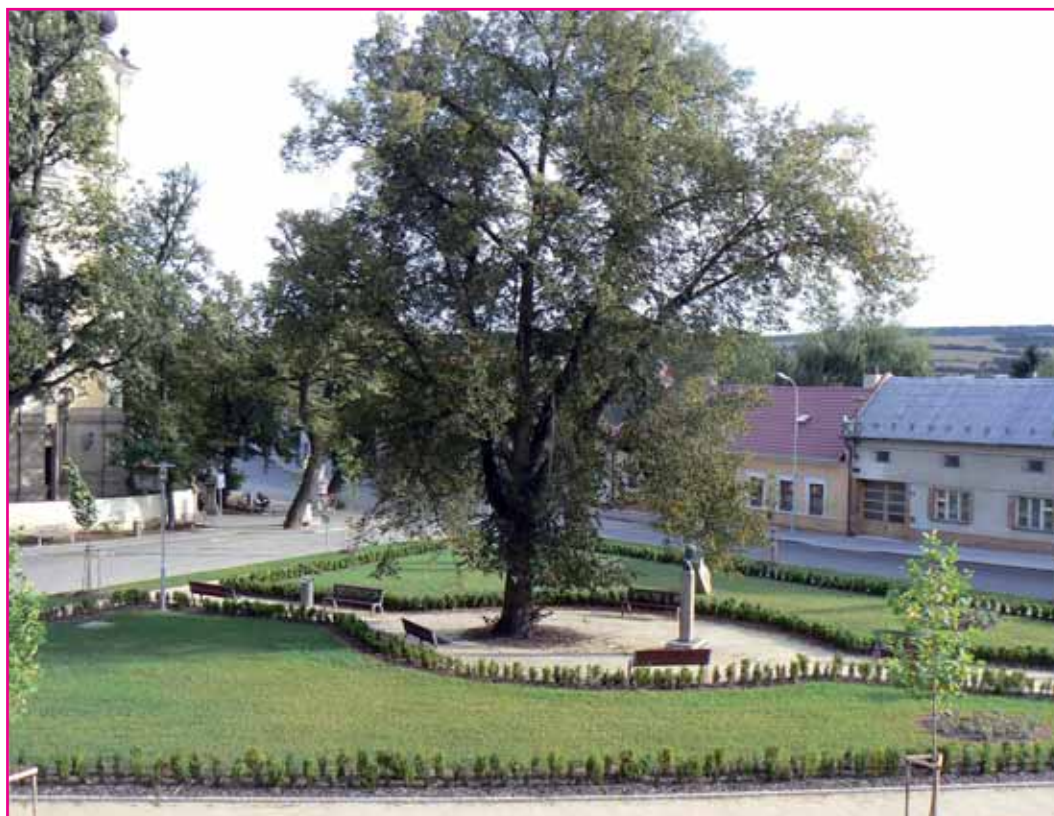
Náměstí A. Dohnala po rekonstrukci.