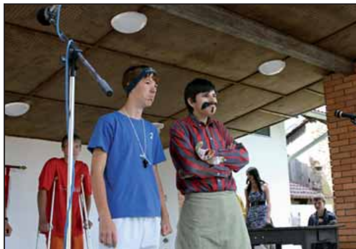
Scénka o historii Kvasic.