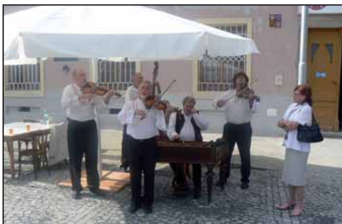
Cimbálová muzika Dubina.