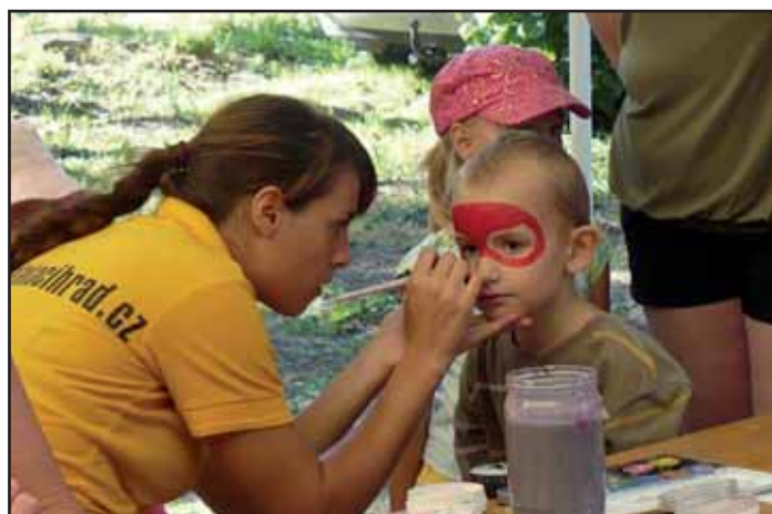
Slavnost pod lípami.