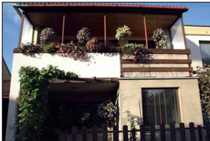
1. místo p. Z. Novotná.