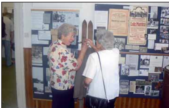
Muzeum historie Kvasic.