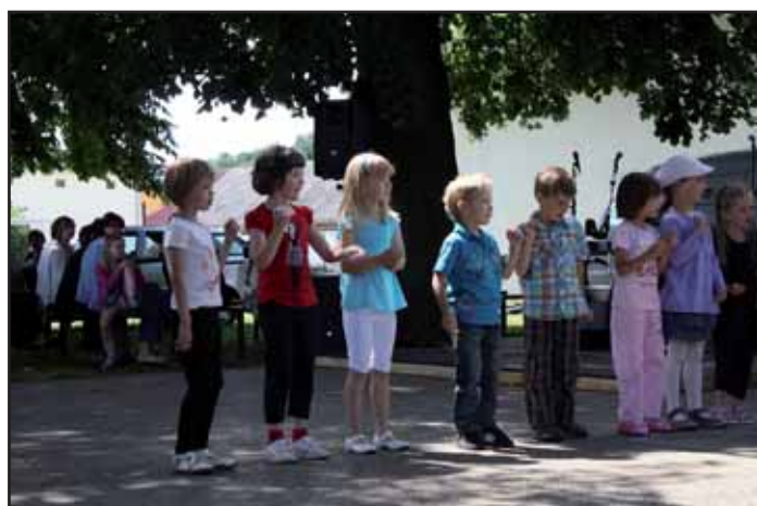
Vystoupení dětí z MŠ Kvasice.