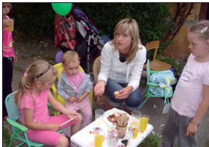
Dětský den v Kalíšku.