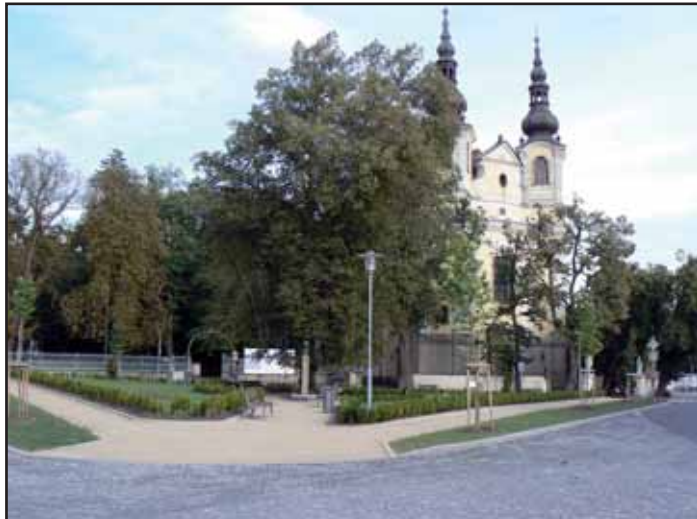
Náměstí po úpravě.