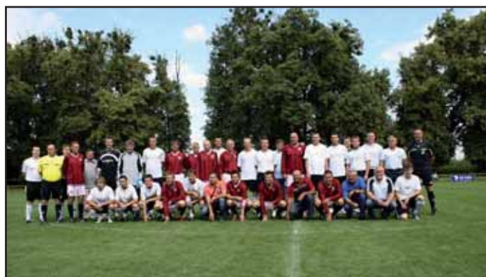
Kvasice a Sparta.