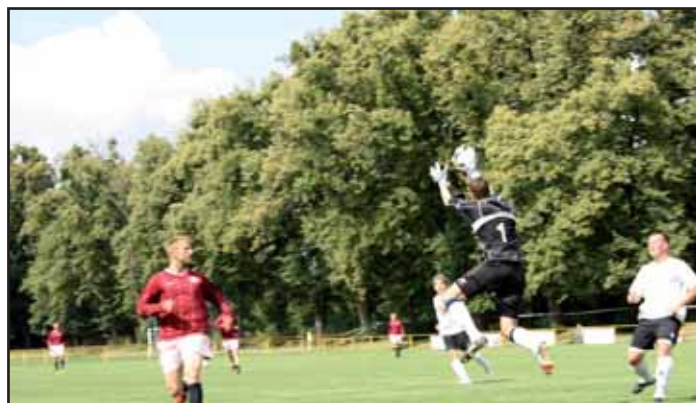
Výborný zásah brankáře.