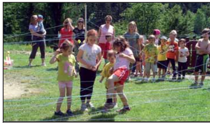
Bobři na Valašce.