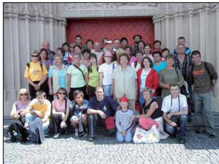
Jednodenní pouť do Mariazell.