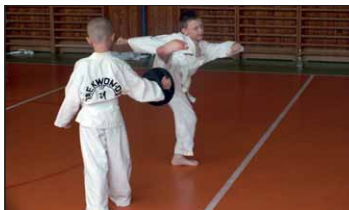
Klukům bojové umění jde.