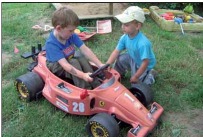
Dětský den v Kalíšku.