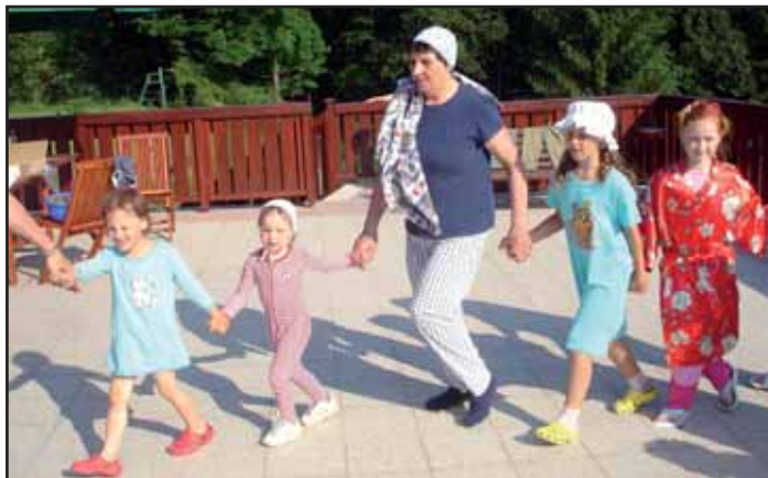
Bobři na Valašce.