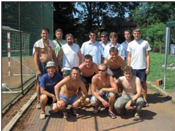
Turnaj v nohejbale se vydařil.