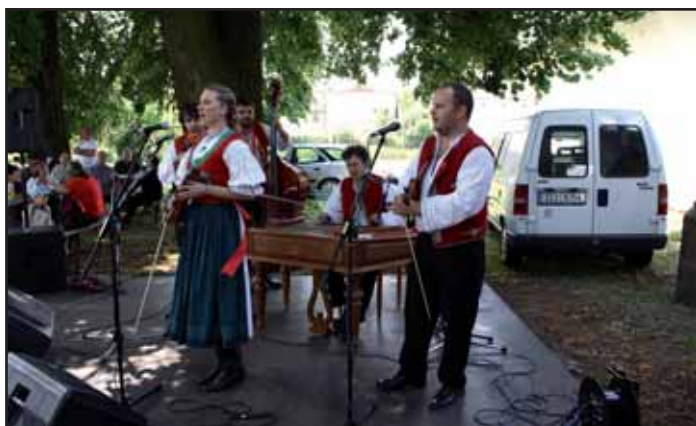
Cimbálová muzika TOŽ TAK.