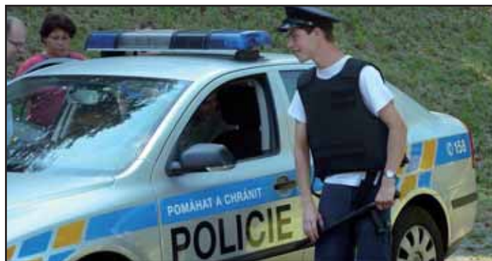
Slavnost pod lípami.