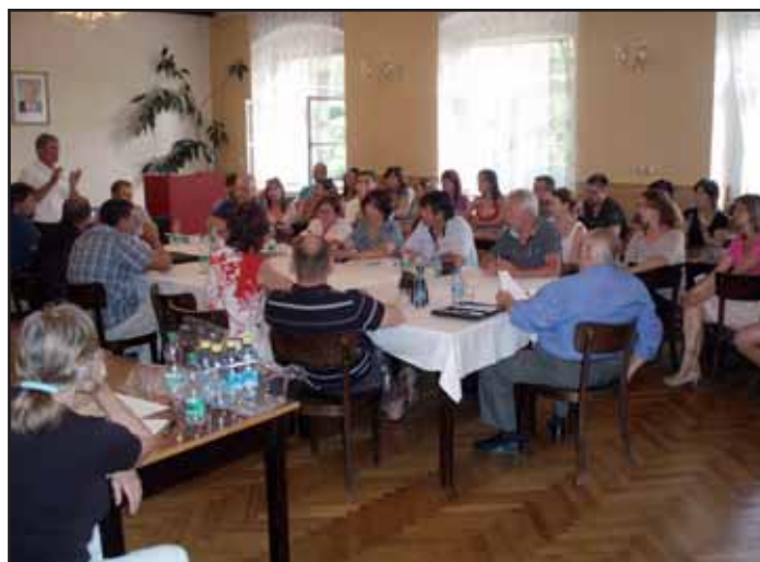
Veřejné zasedání - na programu MŠ Kvasice.