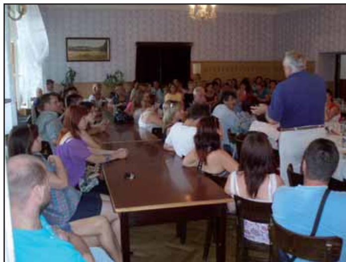
Veřejné zasedání - na programu MŠ Kvasice.