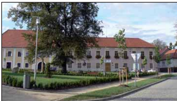
Náměstí po úpravě.