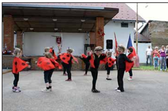
Hostům zatančily Berušky.