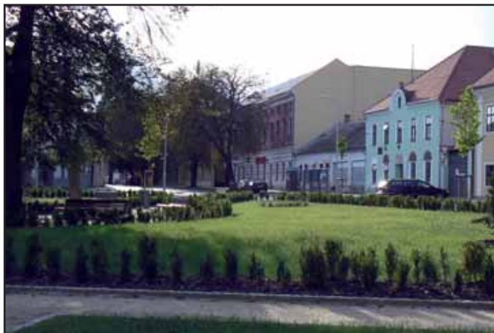
Náměstí A. Dohnala na podzim 2011.