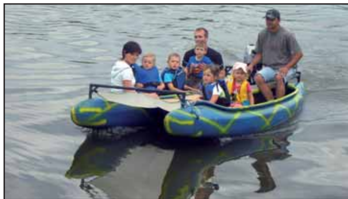
Dětský den v Kalíšku.