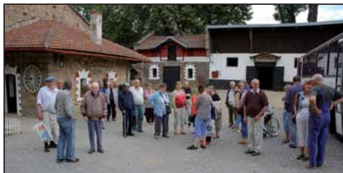
V hřebčíně v Napajedlech.