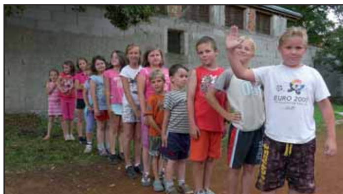
Dětem se na táboře líbilo.