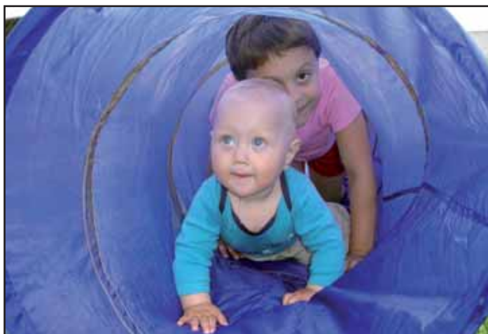
Dětský den v Kalíšku.