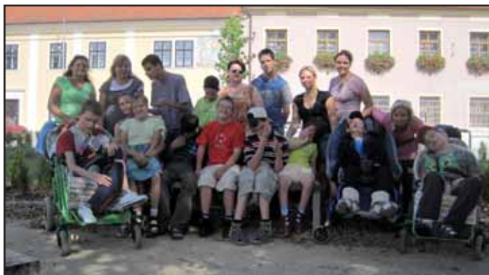
Ve Kvasicích je nám dobře.

1. září 2011 začal nový školní rok a já bych se ráda prostřednictvím stránek Kvasických novin pokusila vyvrátit jeden zažitý mýtus mezi laickou a, jak bohužel zjišťuji, někdy i odbornou veřejností, a totiž nepravdivou informaci o tom, že naše škola je určena pouze žákům, kteří jsou zároveň uživateli Domova pro osoby se zdravotním postižením Kvasice. Setkala jsem se mezi lidmi dokonce s názorem, že jde o jednu a tutéž organizaci, s čímž samozřejmě nemohu souhlasit.