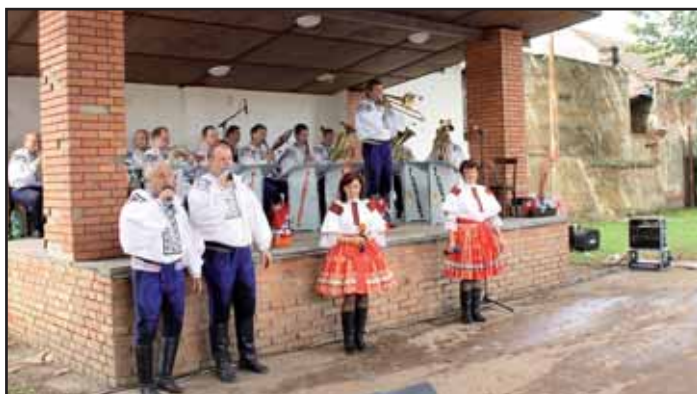
Vlčnovjanka hrála k dobré pohodě.