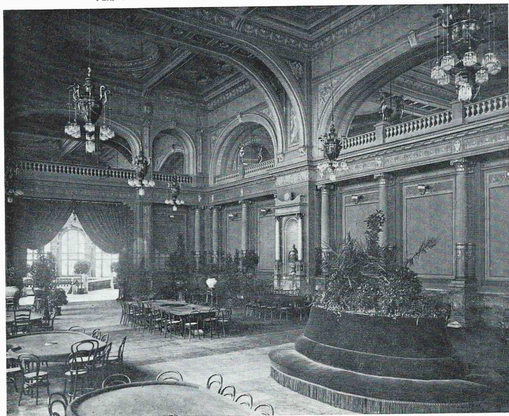
Speelzaal in het Kursaal, foto, S.A.O. (z.d.).