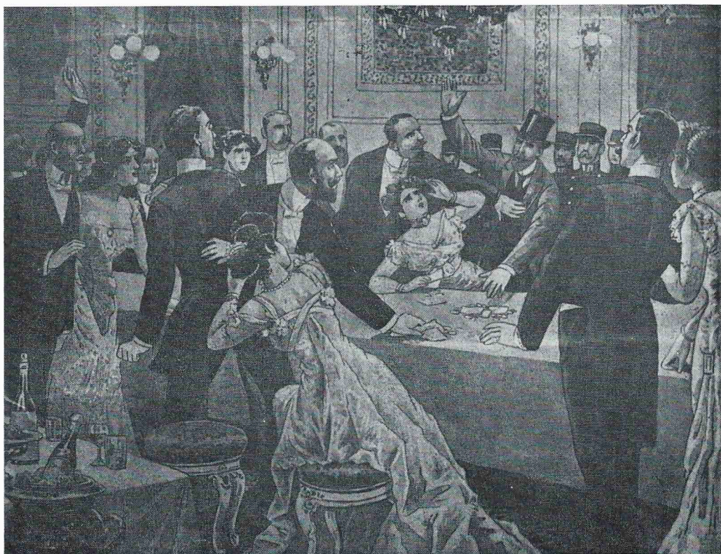
Razzia in het Kursaal, naar een Duitse illustratie, verz. De Plate (z.d.).