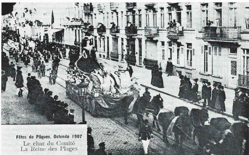
Een wijze waarop Marquet populariteit verwierf, prentbriefkaart (1907).