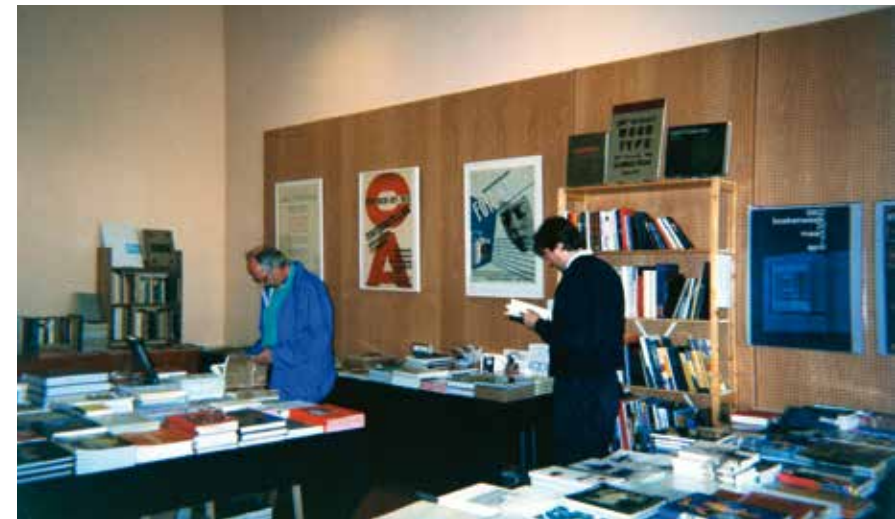
Nijhof & Lee boekenstand tijdens Atypl congres Lyon, 1998