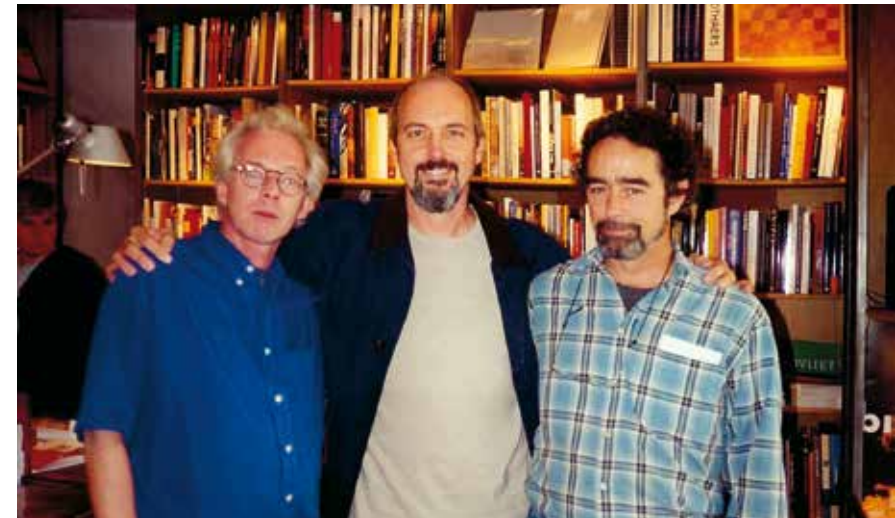
Bill Viola op bezoek. De etalage was voor hem, 1998