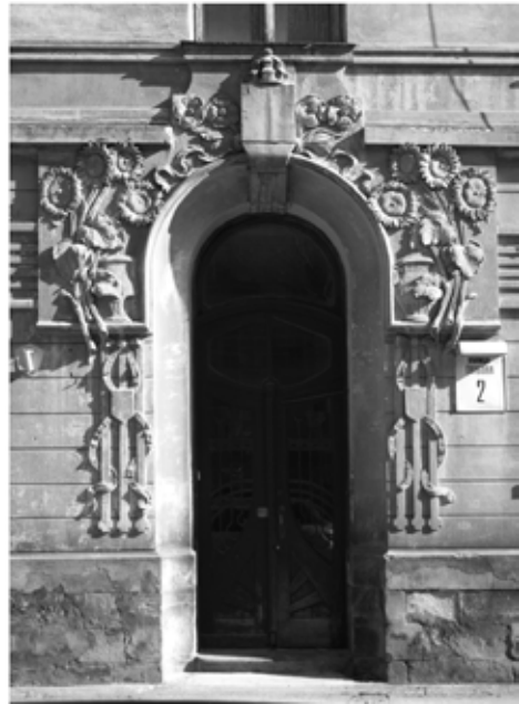
Типово сецесійні форми львівських фасадів, проєктованих Обмінським у середині 1900-х рр.: вул. Чайковського, 6 – причілок кутового еркера; Богомольця, 4 – аттик з маскою; Павлова, 2 – маска під карнизом; Глібова, 2 – рельєфи вхідного порталу (фото І. Жука).