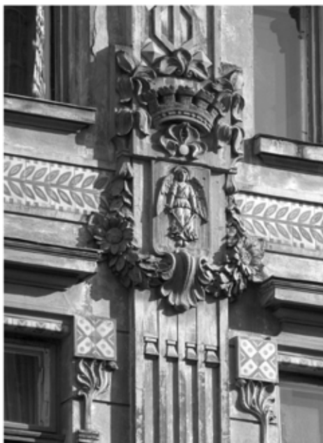
Вул. Руська, 20 – північний фасад будинку “Дністра” і відповідна деталь архітектурного рисунку, виконаного Т. Обмінським (ДАЛО. – Ф. 2. – Оп. 2. – Спр. 3806. – Арк. 102). Сецесійні маски, передбачені у проекті, було замінено на рельєфні герби.