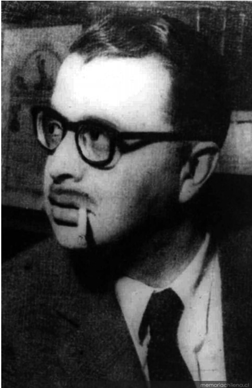
Guillermo Atías en 1963.