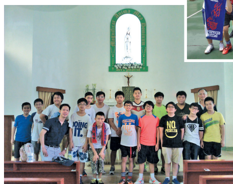
慈青李納德善會朝聖旅行