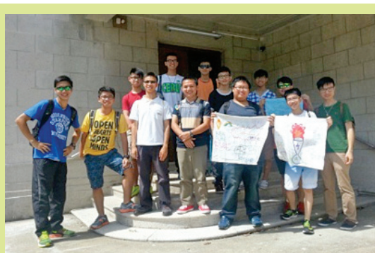
慈青輔祭會暑期信仰生活營