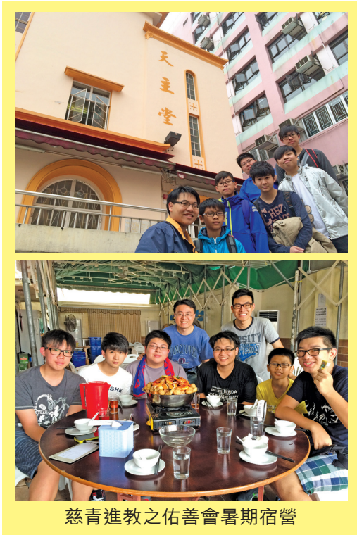
慈青進教之佑善會暑期宿營