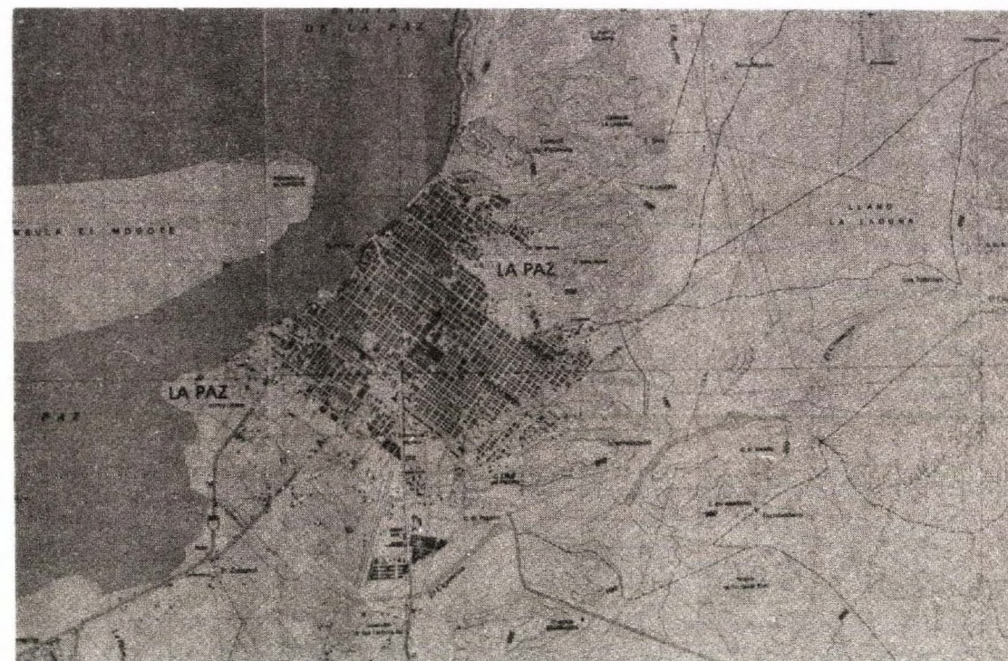
La Paz. Detalle de la carta topográfica, clave de la carta G12D82, 1976. Secretaría de Programación y Presupuesto, México. Escala 1:50 000

Asimismo, la asociación de los municipios se expresa en el artículo 126 de la Constitución Política del Estado de Baja California Sur indicando que se llevará de acuerdo a: