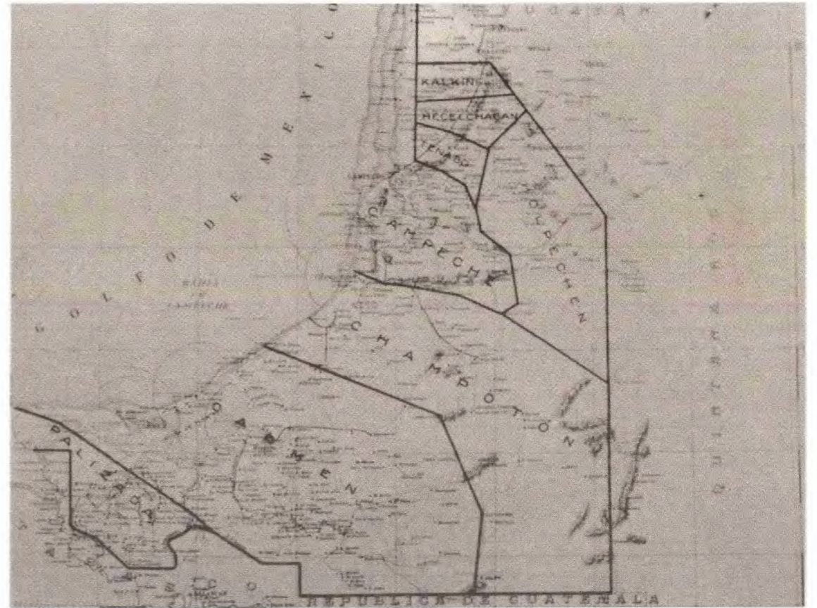
Mapa del Estado de Campeche, 1923. Secretaría de Agricultura y Fomento, Dirección de Estudios Geográficos y Climatológicos. Sin escala.