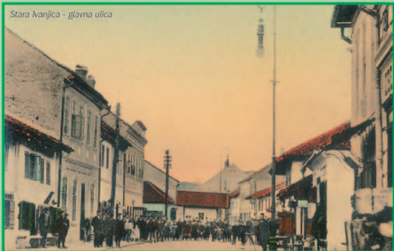
Stara Ivanjica - glavna ulica