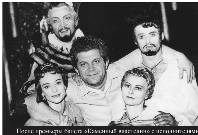
После премьеры балета «Каменный властелин» с исполнителями

Запрошуємо на концерти XVI міжнародного фестивалю класичної музики «Харківські Асамблеї» (вересень, 2009). У програмі — твори Віталія Губаренка харківського періоду: I симфонія, квіртет, моноопера «Листи кохання», вокальні цикли.