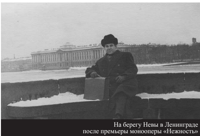
На берегу Невы в Ленинграде после премьеры монооперы «Нежность»