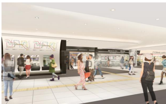
△「EQUiA北千住」中央改札口周辺（イメージ）