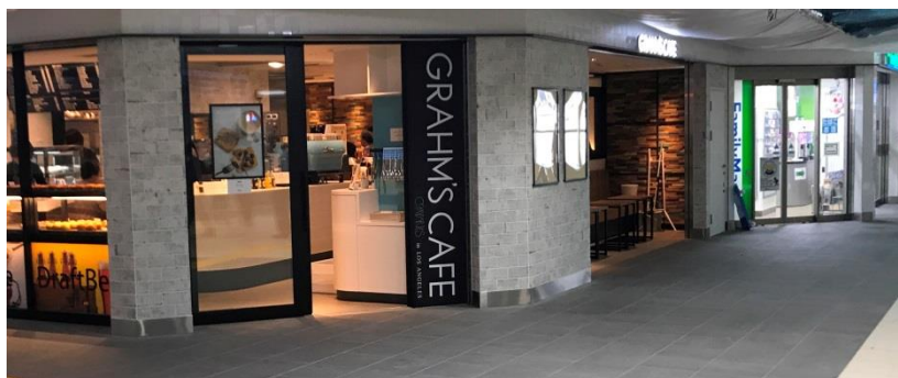
△先行オープン店舗（グラムズカフェ・ファミリーマート）