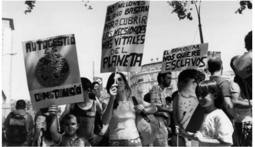
Manifestación en Barcelona contra la globalización

Sus voceros han llegado a decir que lo de Nueva York y Washington, el 11 de septiembre, es el acontecimiento mundial más importante acaecido desde la segunda guerra mundial. Esto es falso completamente. El pueblo de Estados Unidos, dolorido y manipulado hasta las náuseas por sus dirigentes aireándoles sus cinco mil muertos, se prepara para una guerra intensa y sucia. Da rabia ver los impactos terroristas de los aviones contra edificios llenos de gente, pero también da una inmensa rabia observar la amnesia de genocidios perpetrados entre hutus y tutsis, en Etiopía y Eritrea. En Vietnam, en Sudamérica y en los Balcanes..., los enfermos que mueren sin asistencia por los sucesivos bloqueos. Son víctimas de Estados Unidos y la globalización capitalista, los sacrificados en Yugoslavia, Medio Oriente, África, América del Sur y Asia; los inmi-