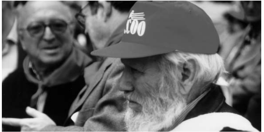
Los luchadores por la democracia no tendrán reparación moral y económica

En conversación con Francisco Estrella, secretario general de CCOO en Osona, manifiesta que lo que ha inducido a este grupo de personas a trabajar en este proyecto, ha sido el entender que, pese al evidente avan-