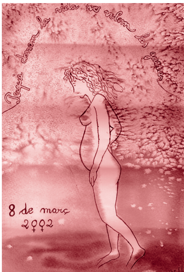
Perquè donem la vida, no volem les guerres. Dibuix: M a Llorente

per exigir de formar part numèrica important de les grans decisions en què, sense voler ens veiem implicades, reforçar les organitzacions de dones que porten endavant lluites incruentes per defensar la vida de tot el planeta, per deixar de pagar els plats que altres trenquen, i perquè, tret d'estranyes excepcions, les noies no som guerreres.