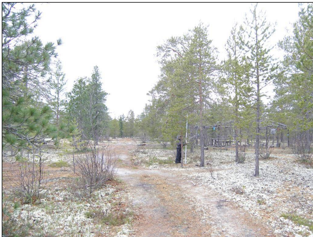
Фото 1. Вид на остатки сооружения №3 выявленного объекта археологического наследия «Поселение Сугмутен-ягун 4». Снято с востока.