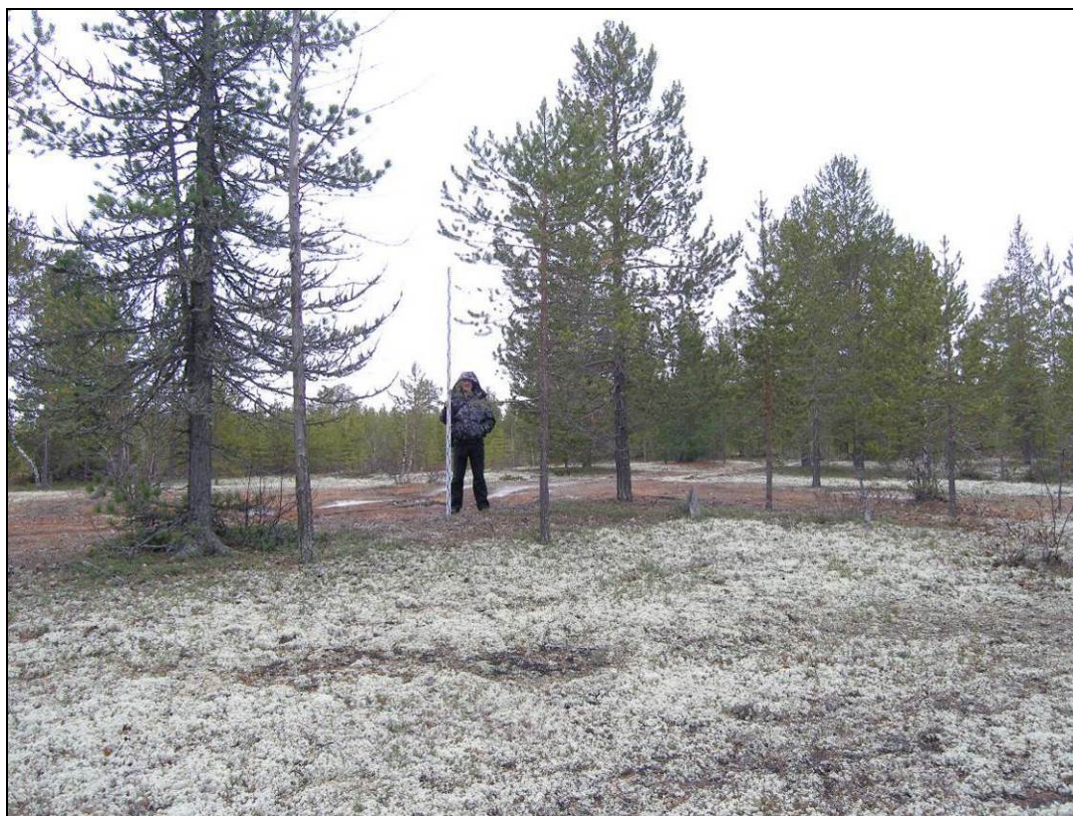
Фото 2. Вид на остатки сооружения №2 выявленного объекта археологического наследия «Поселение Сугмутен-ягун 4». Снято с северо-востока.