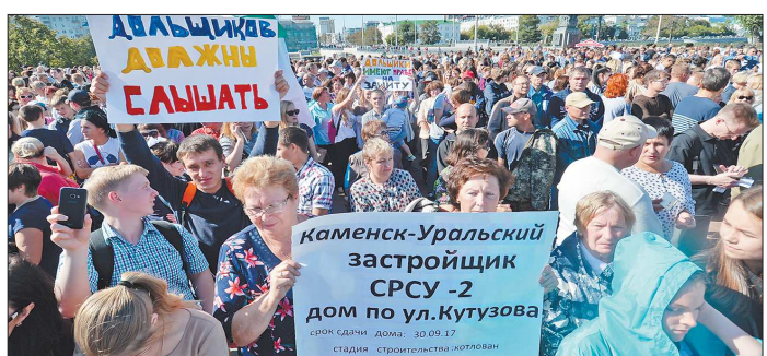
Решением проблем существующих застройщиков сейчас занимаются власти области. Фонд сможет выделять средства только на дома, которые начали строить не раньше 2018 года