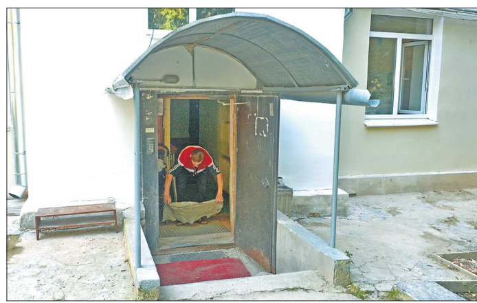
Теперь жильцы домов, в которых проходит капремонт, должны стать более гостеприимными по отношению к подрядчикам

МЕХАНИЗМ. Теперь после того как жильцы одной или нескольких квартир начинают препятствовать проведению ремонтных работ, запланированных в программе, капремонт дома подрядчик приостанавливает. После этого жильцам многоквартирного дома даётся время для того, чтобы провести общее собрание и решить — будут они продолжать ремонт или нет. Предполагается, что за это время они смогут по-соседски воздействовать на противников капремонта: убедить их в необходимости проведения работ и необратимости последствий. В противном случае жильцы, которые не желают пускать подрядчика в квартиры, должны оформить специальный акт об отказе и передать его в Фонд капремонта области.