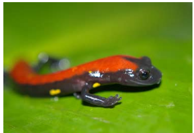
This new species of salamander is one of 3 discovered in an unexplored forest in Costa Rica

De l'insecte le plus long du monde et les régimes du Neandertal, à un nouvel insecte mystérieux et à une mite de deux sexes, lisez certaines de nos récits fascinants de l'histoire naturelle depuis 2008.