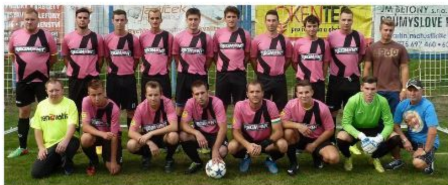
Muži B - sezóna 2015/2016