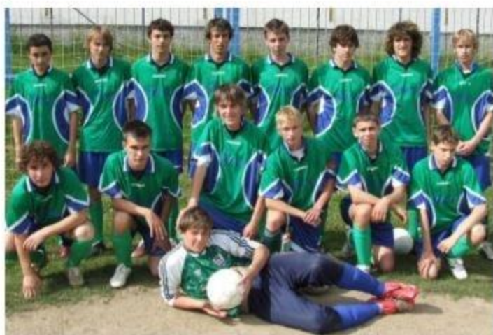
Dorost - rok 2008