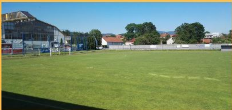
Fotografie zuberského fotbalového areálu - rok 2017