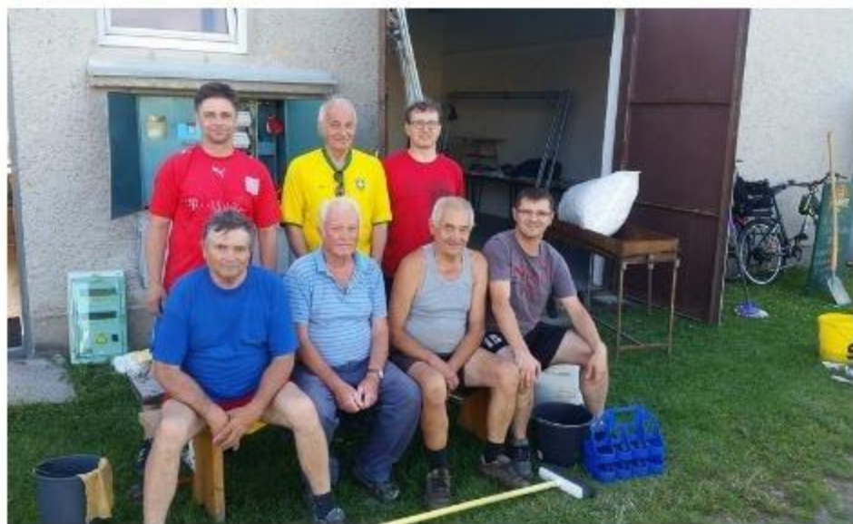
Výbor FC Zubří při přípravách, úklidu hřiště a okolí pro oslavy 80-ti let zuberského fotbalu