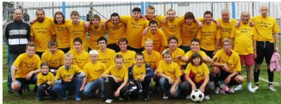
Muži A, postup do I.A třídy - rok 2009