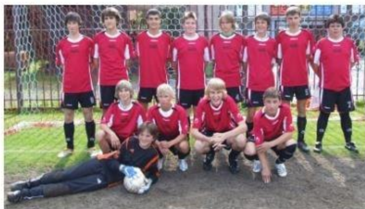
Starší žáci - rok 2005