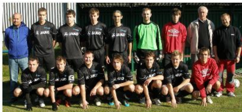
Muži A - sezóna 2011/2012