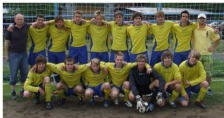
Dorost - sezóna 2009/2010 - vítěz okresního přeboru