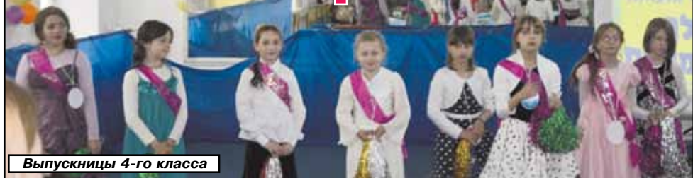
Выпускницы 4-го класса

Июнь - время выпускных балов. Обычно слово «выпускник» связано с учащимися одиннадцатого класса, которые уходят из школы. Но по давнейшей традиции выпускниками называют и тех, кто окончил четвертый класс. Потому что начальная школа закладывает основы для дальнейшей учебы. И окончание этого этапа школьной жизни завершается выпускным балом.