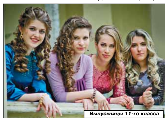
Выпускницы 11-го класса