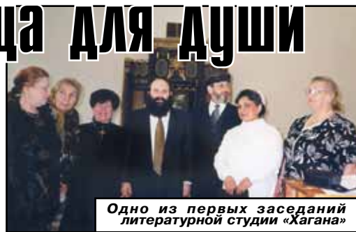
Одно из первых заседаний литературной студии «Хагана»

ровлянского «Баллады Прекрасным дамам». Игорь с большим удовольствием давал желающим автографы.