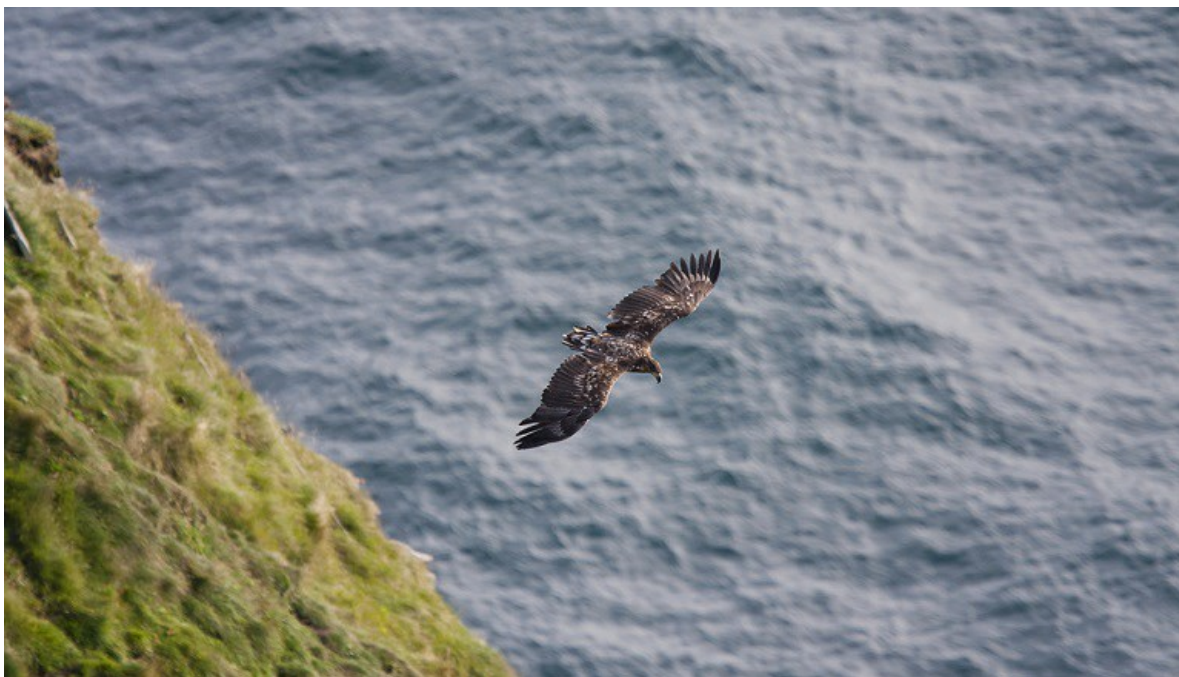
Havørn står oppført på Bonnkonvensjonens liste I.