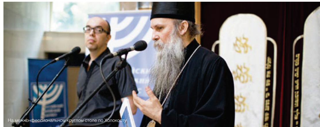
На межконфессиональном круглом столе по Холокосту

посещением Музея еврейского наследия и Холокоста, размещенного в синагоге.