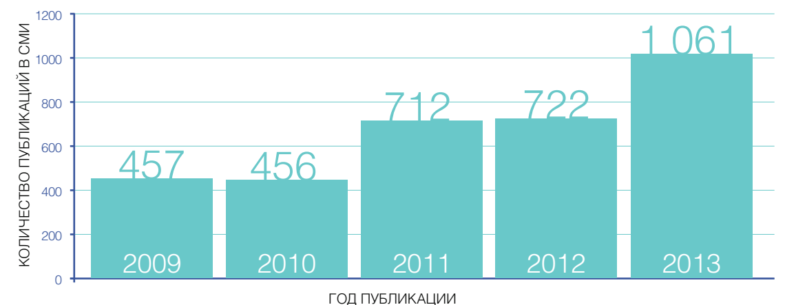
ДАННЫЕ «ЯНДЕКС-НОВОСТИ» ПО ЗАПРОСУ: РОССИЙСКИЙ ЕВРЕЙСКИЙ КОНГРЕСС

РЕК - АВТОРИТЕТНЫЙ И НАДЕЖНЫЙ ИСТОЧНИК ИНФОРМАЦИИ ДЛЯ СОТЕН ТЫСЯЧ ЧЕЛОВЕК В РОССИИ И МИРЕ