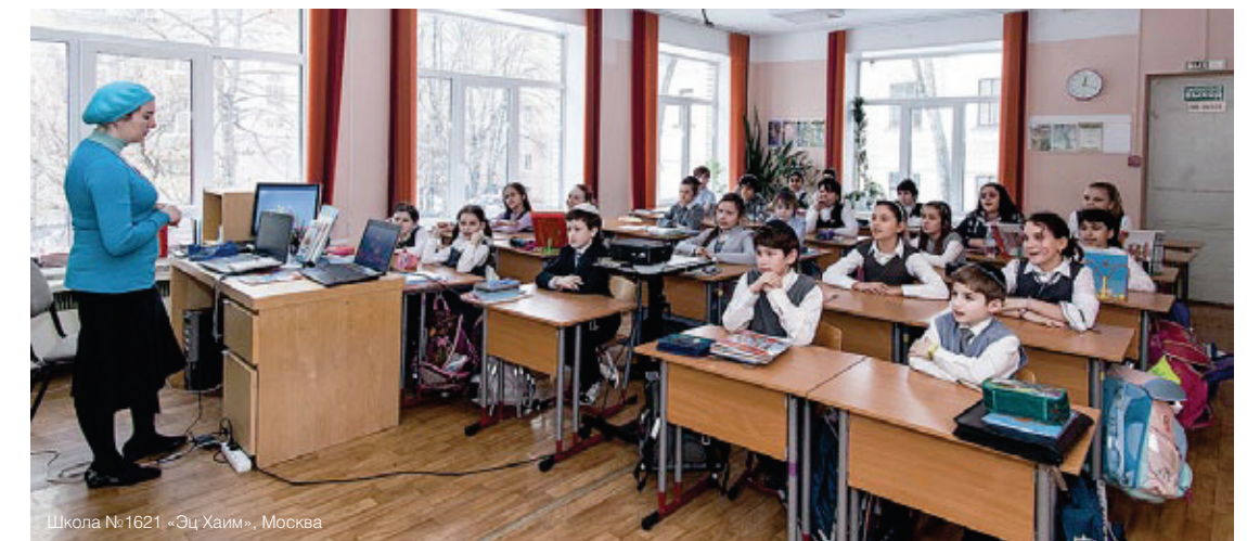
Школа №1621 «Эц Хаим», Москва

При поддержке РЕК создана сквозная система еврейского образования от детских садов до высших учебных заведений.