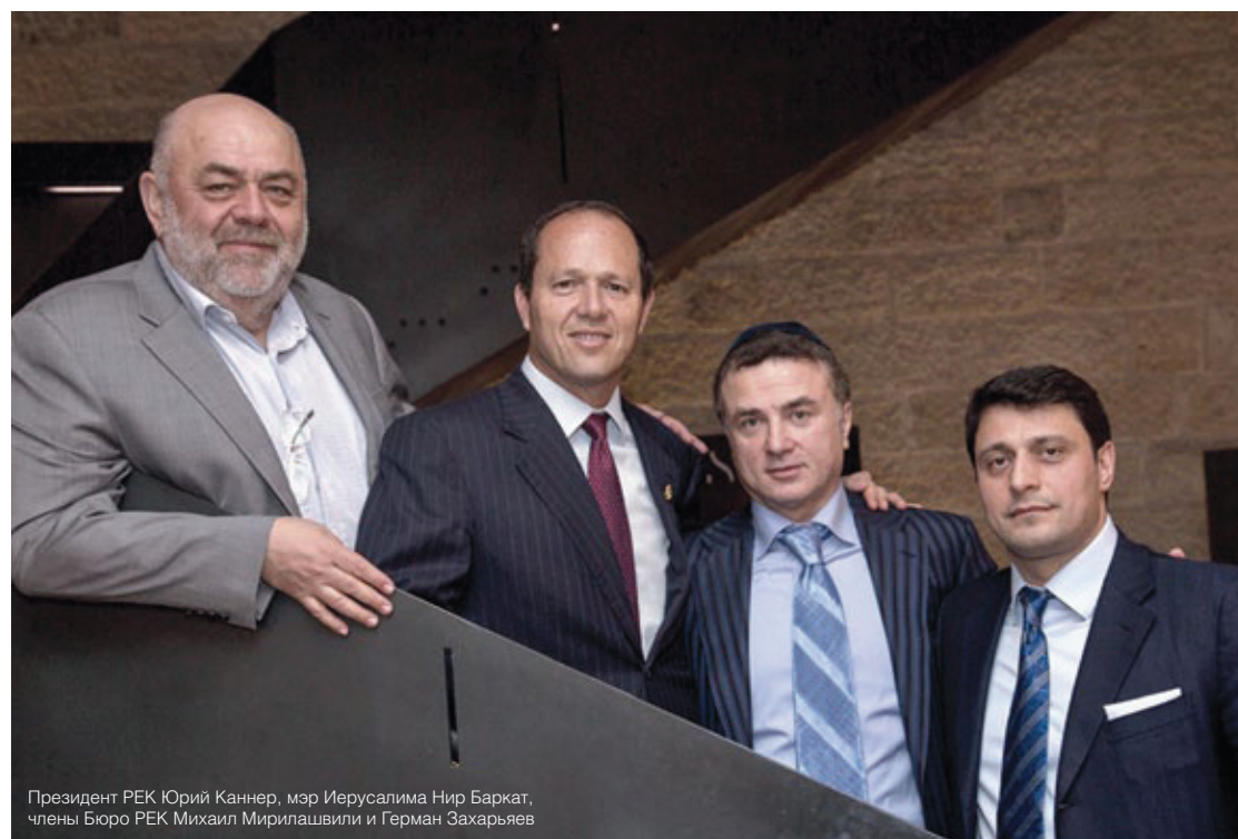
Президент РЕК Юрий Каннер, мэр Иерусалима Нир Баркат, члены Бюро РЕК Михаил Мирилашвили и Герман Захарьев