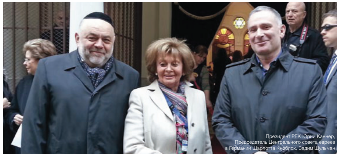
Президент РЕК Юрий Каннер, Председатель Центрального совета евреев в Германии Шарлотта Кноблох, Вадим Шульман

Конгресс стремится привлекать внимание ко всем вопиющим фактам проявления антисемитизма.