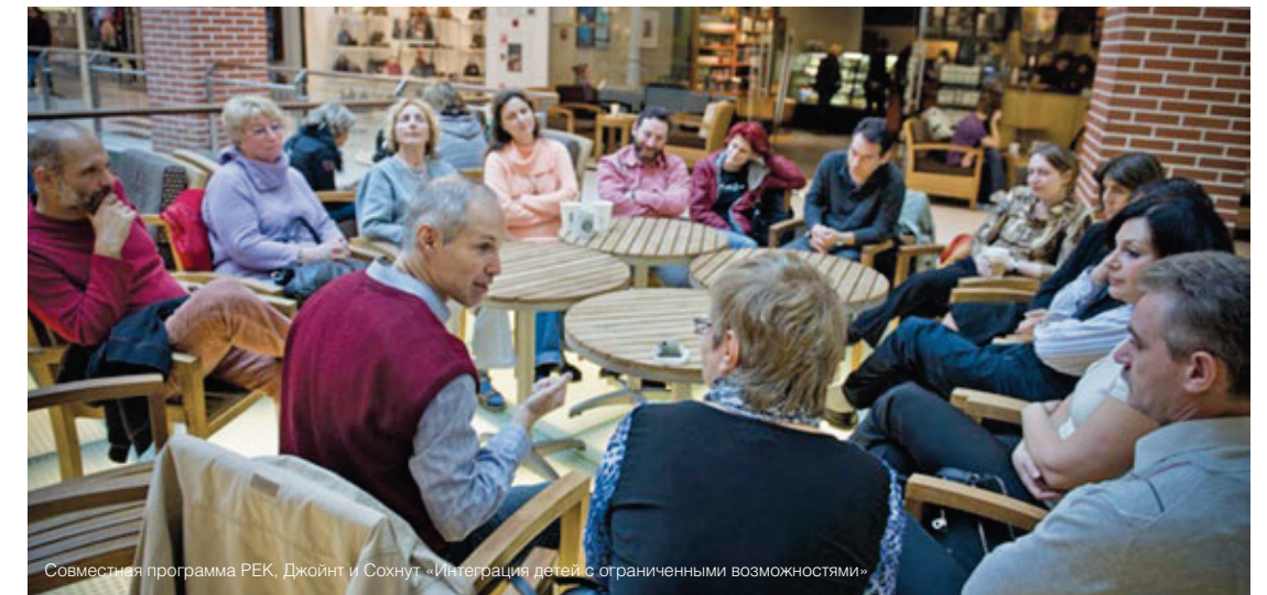
Совместная программа РЕК, Джойнт и Сохнут - Интеграция детей с ограниченными возможностями»

В 2013 г. по решению Конгресса создан Совет директоров еврейских школ. Предполагается оснащение на его базе методического кабинета по предметам этнокультурного компонента.