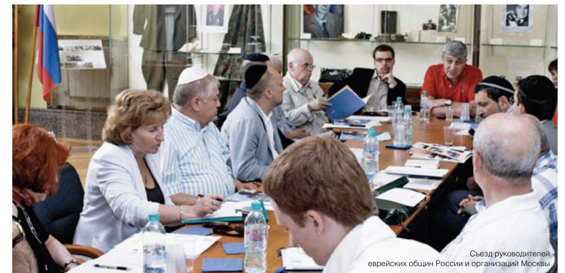
Съезд руководителей еврейских общин России и организаций Москвы

ности регионам. Конгресс не только поддерживает существующие и содействует формированию новых общин, но и помогаем им упрочить свое положение. В частности, находить источники собственного финансирования и обеспечивать условия для самостоятельного распределения средств на нужды местной общины. По этой схеме РЕК сознательно отходит от жесткой вертикали, пирамидальной системы управления, принятой в большинстве еврейских организаций, когда все средства аккумулируются в центральных органах и оттуда распределяются в реги-