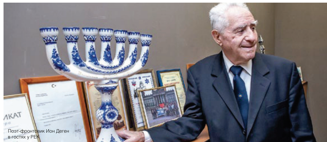
Поэт-фронтовик Ион Деген в гостях у РЕК

Ты не плачь, не стони, ты не маленький, Ты не ранен, ты просто убит. Дай на память сниму с тебя валенки. Нам еще наступать предстоит.