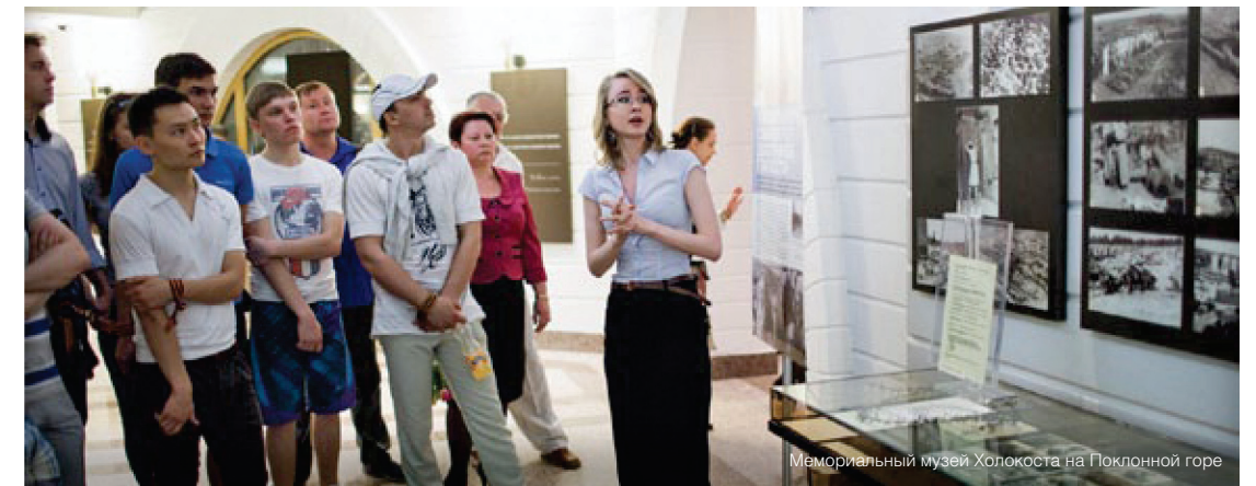
Мемориальный музей Холокоста на Поклонной горе

Многие, в том числе большие поэты, сами фронтовики - Александр Межиров, Борис Слуцкий, Евгений Винокуров, Михаил Дудин, - называли эти строки лучшим военным стихотворением. Еще с войны оно ходило в списках, без имени автора. Считалось - он погиб. Рассказывали: стихотворение нашли в полевой сумке, извлеченной из подбитого танка.