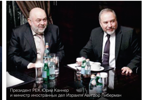
Президент РЕК Юрий Каннер и министр иностранных дел Израиля Авидор Либерман