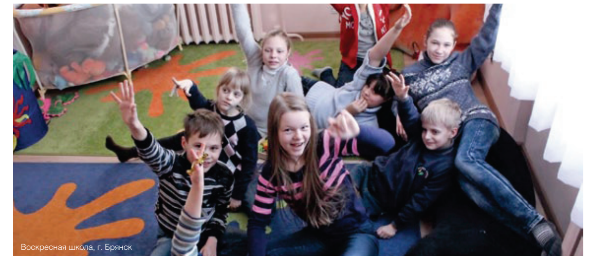
Воскресная школа, г. Брянск

РЕК сотрудничает с престижным московским журналом «Русский пионер». В 2013 году при поддержке и творческом участии РЕК был выпущен специальный «еврейский» номер «Русского пионера». Презентация номера – так называемые «Пионерские чтения» - прошла в Мемориальной синагоге РЕК.