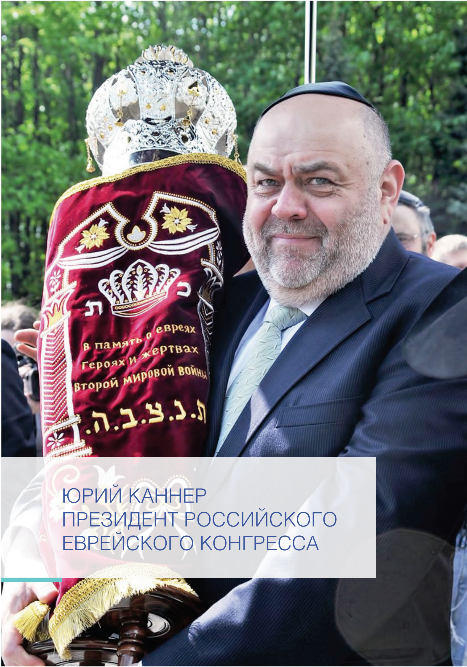
ЮРИЙ КАННЕР ПРЕЗИДЕНТ РОССИЙСКОГО ЕВРЕЙСКОГО КОНГРЕССА