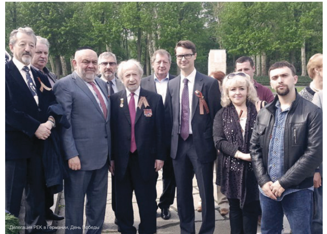
Делегация РЕК в Германии, День Победы

Не так давно началось строительство синагоги в Калининграде. Уникальность этого проекта в том, новое здание будет построено на том же самом месте, где было расположено здание Кёнигсбергской синагоги - одного из красивейших синагогальных зданий в Европе. Синагога сильно пострадала от нацистского погрома во время «Хрустальной ночи» в ноябре 1938 года и была окончательно разрушена в 1941 году. О необходимости ее восстановления в Калининграде говорили с 1992 года, но фактически проект стал обретать реальные очертания лишь несколько лет назад - после того, как его взял под опеку местный бизнесмен и ме-