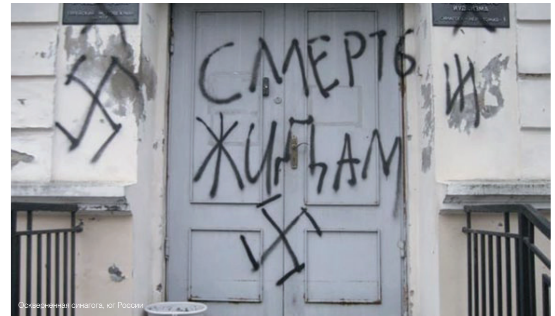
Оскверненная синагога, юг России

Именно РЕК добился, чтобы антисемитские высказывания прокурора и судьи на процессе по делу Ильи Фарбера стали предметом широкого обсуждения в СМИ, социальных сетях и обществе. Не исключено, что это сыграло свою роль в том, что в судьбу сельского учителя из Тверской области вмешался лично президент России В.В. Путин, и в конечном счете Фарбер был освобожден по амнистии. РЕК стал единственной еврейской организацией России, выразившей осуждение антисемитскими высказываниями на ВГРТК, когда ведущая Эвели-