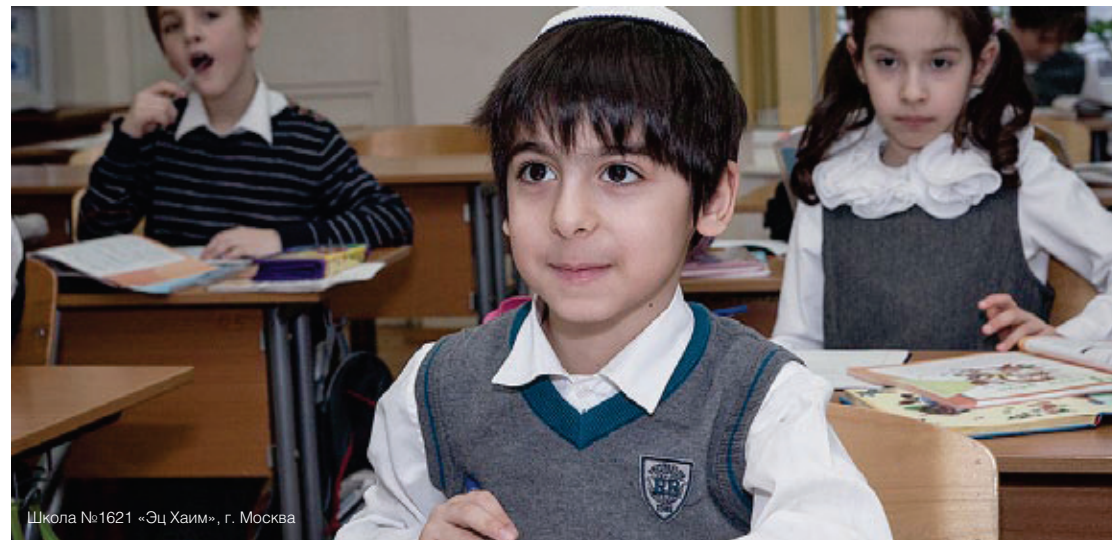
Школа №1621 «Эц Хаим», г. Москва

Наши главные вложения в образование идут на создание и поддержку единой, бесперебойной системы еврейского образования, которая позволяет детям погружаться в традицию своих предков с малых лет, дает им возможность посещать кружки по изучению традиций, праздников и танахических историй, молодежи - изучать еврейские дисциплины в ведущих вузах страны и проводить академические исследования в авторитетных научных школах.