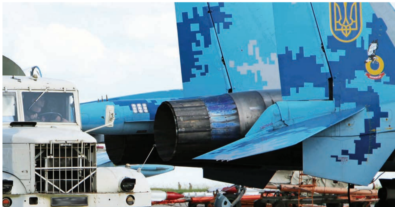
Віднедавна на Житомирщині дислокується вже не окрема авіаційна ескадрилья, а бригада тактичної авіації

ПРОТЯГОМ ДВОХ ОСТАННІХ РОКІВ ПОВІТРЯНІ СИЛИ ОТРИМАЛИ ПОНАД 6 ДЕСЯТКІВ ВІДРЕМОНТОВАНИХ ТА МОДЕРНІЗОВАНИХ ЛІТАЛЬНИХ АПАРАТІВ