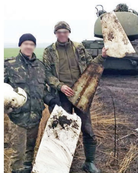
Результати полювання на ворожі БпЛА

— Зараз же ситуація спокійніша. Тож є час оцінити обстановку, спрогнозувати маршрут польоту, визначити засоби для знищення цілі та вчасно змінити позицію після пуску ракети, — продовжує офіцер. — Тим не менше, лише кілька місяців