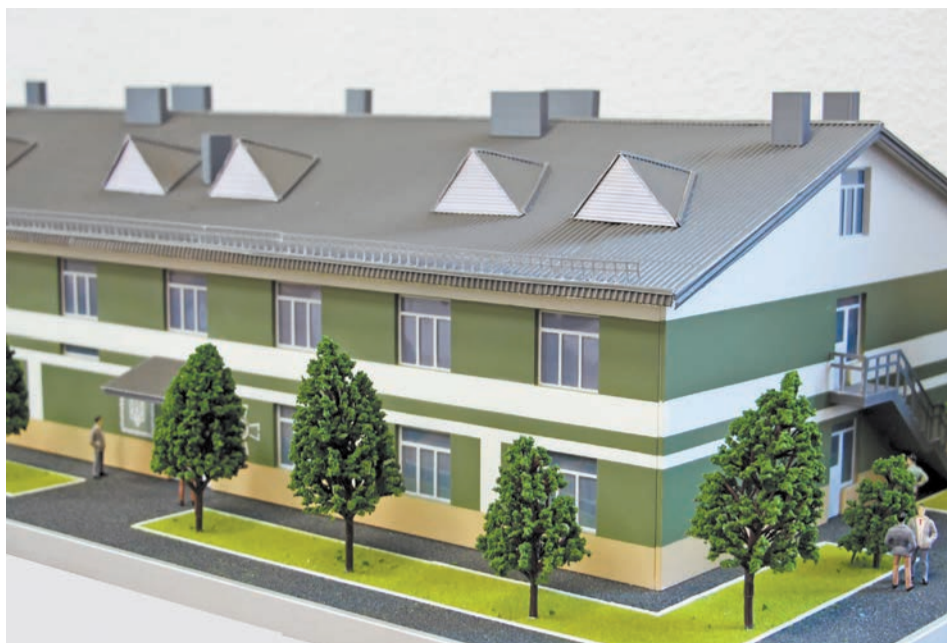
Так виглядатимуть сучасні гуртожитки для контрактників нашого війська