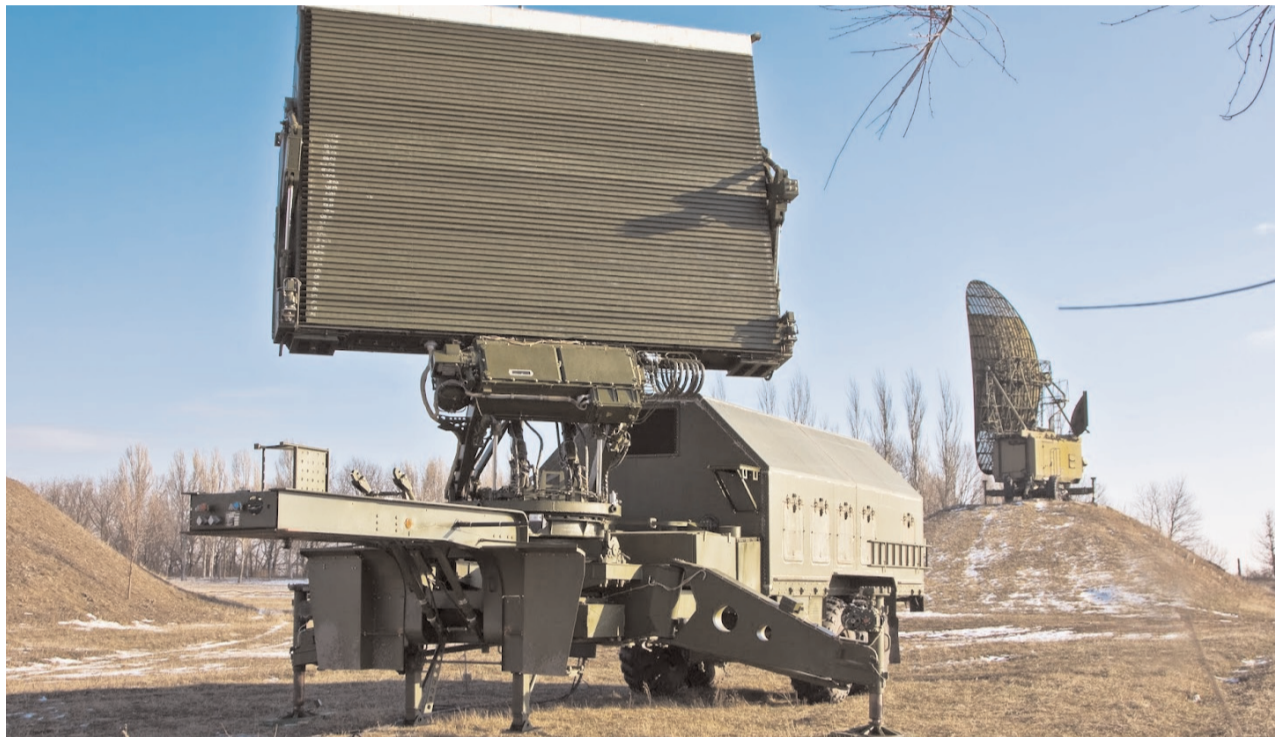
Радіолокаційна станція «Пелікан» призначена для роботи в умовах наявності перешкод природного та навмисного типу

До 2014 року оновлення парку техніки, зокрема РТВ Повітряних Сил ЗС України, здійснювалося здебільшого епізодично, бо військо фінансувалося за залишковим принципом. Впродовж останніх років на потреби війська, зокрема на його технічне підсилення, виділяються значні ресурси. Оптимізму додає й вітчизняна промисловість. Україна має потужний науково-виробничий потенціал з виготовлення ОВТ РТВ: науково-виробничий комплекс «Іскра», холдингова компанія «Укрспецтехніка», акціонерне товариство «Аеротехніка-МЛТ» тощо. Ці підприємства здатні повною мірою забезпечити потреби радіотехнічних військ у сучасних РЛС, що за своїми ТТХ не поступаються найкращим світовим зразкам