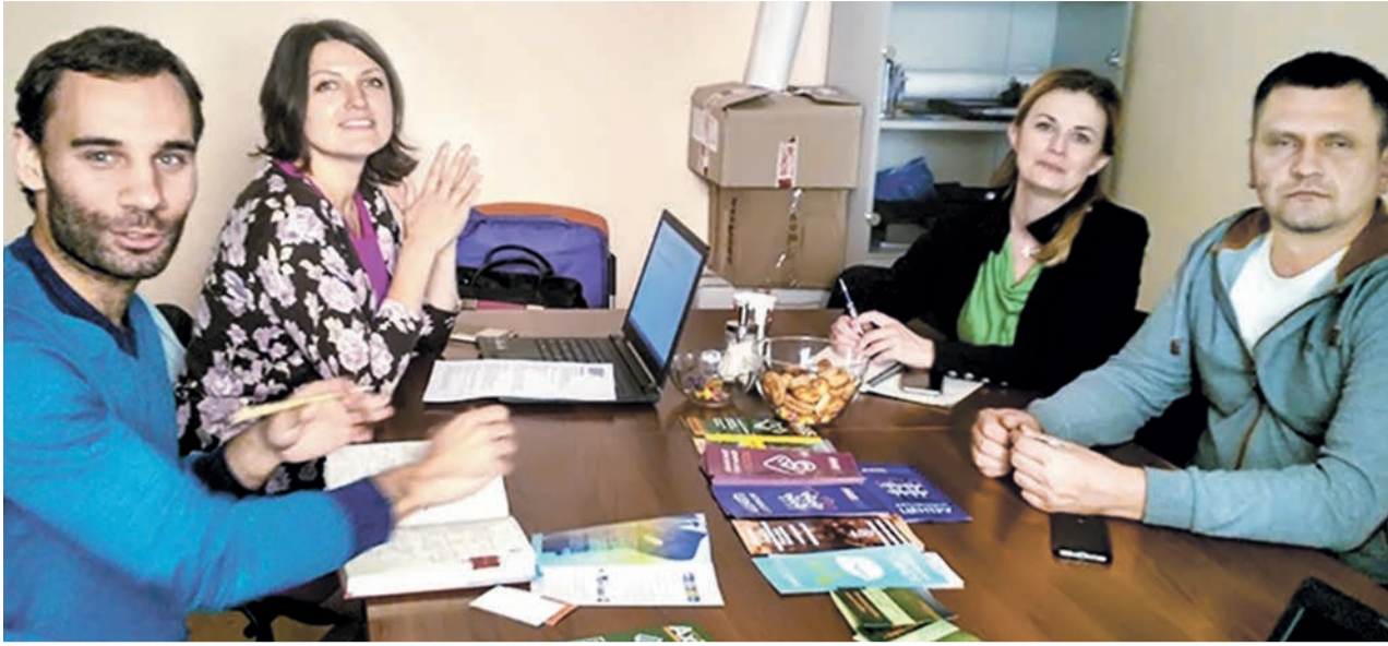
Команда центру практичної допомоги ветеранам АТО