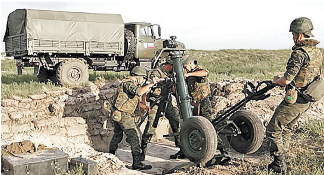
«Мирні шахтарі й металурги Донбасу» вже давно краще вправляються з мінометною станиною, аніж із відбійним молотком