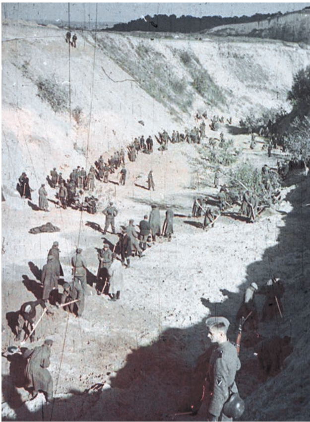
У вересні 1941 року фашисти за одну ніч розстріляли у Бабиному Яру близько 30 тисяч київських євреїв

Від столичної вулиці Мельникова до меморіалу «Бабин Яр» проклали Алею праведників. Я прямую нею і думаю про те, що вже сама її назва дуже красномовна. Люди, яких увіchnили на ній, були праведними. Як і справа, за яку вони віддали життя під час окупації Києва фашистськими загарбниками. По лівий бік алеї ніби у скорботній переключці вишикувалися надгробки. Вони колись стояли на могилах столичного єврейського кладовища. За радянських часів його зрівняли із землею. Нині ці надмогильні плити — як свідчення несправедливої політики колишньої влади у ставленні до людей.