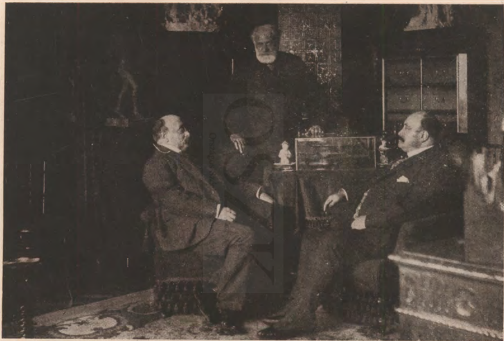
Találkozás Kossuth Ferenc lakásán (Kossuth Lajos Tivadar, Thaly Kálmán és Kossuth Ferenc).