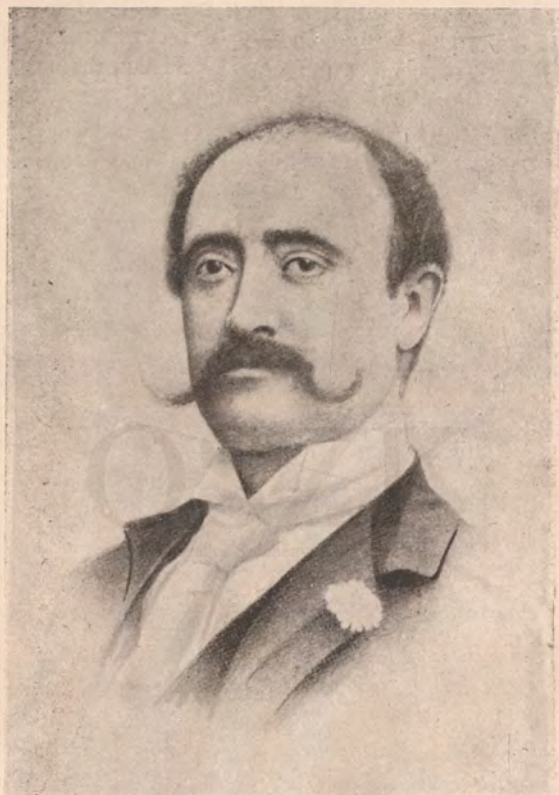
Kossuth Ferenc arcképe a 80-as évekből.