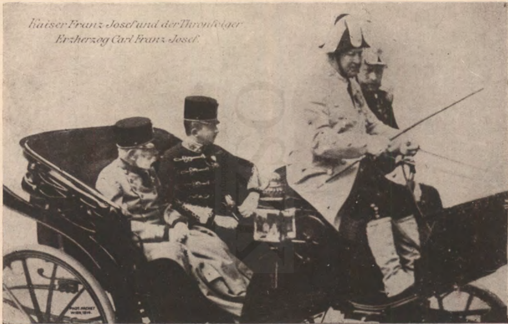
I. Ferenc József és Károly trónörökös, a későbbi IV. Károly.

Kaiser Franz Josef und der Thronfolger Erzherzog Carl Franz Josef.