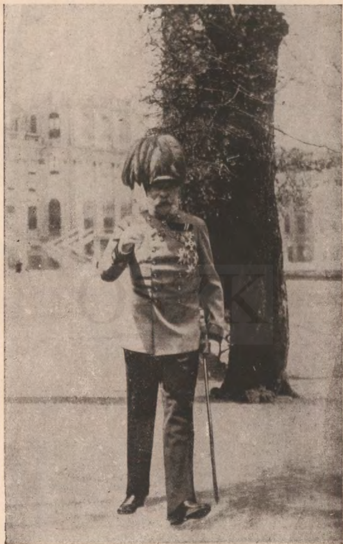
I. Ferenc József.