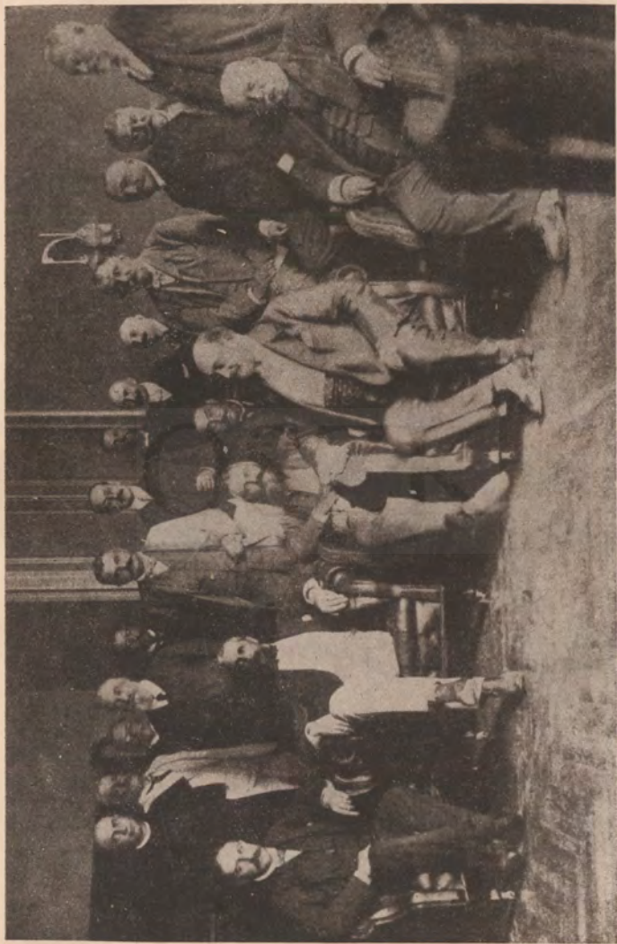
A függetlenségi párt intéző-bizottsága.