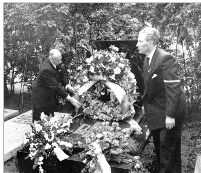
Квіти на могилу Є. Коновальця

У двадцять роковини смерті Євгена Коновальця прибули до міста його загину, сотні синів і дочок українського народу,