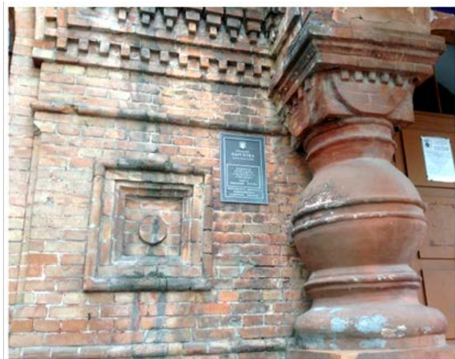
Ремісничо-грамотне училище у Кіровограді