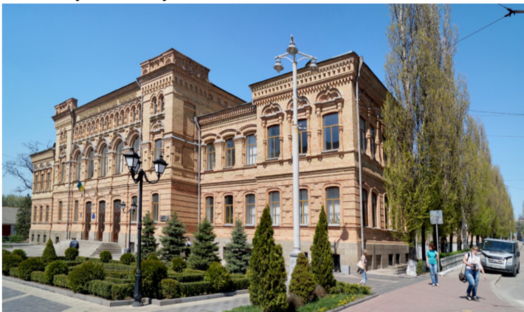
Кіровоградський державний педагогічний університет імені Володимира Винниченка

У часи Першої світової війни у приміщенні гімназії розміщувався госпіталь російської армії, радянські музичний комітет і музейне фондосховище, відділ освіти, червоноармійський лазарет, потім – українська гімназія. Згодом на початку вулиці Шевченка почергово діяли педагогічний технікум та інститут соціального виховання. На початку Другої світової війни тут знову розміщуються червоноармійський, а в період окупації – німецький госпіталь. В мирний час у державному педагогічному інституті ім. О. С. Пушкіна готували вчителів.