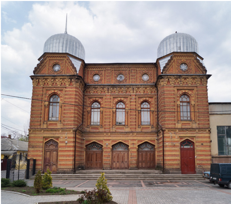
Кіровоградська Велика хоральна синагога

Кіровоградська Велика хоральна синагога – юдейська культова споруда-синагога – велична міська історико-архітектурна пам'ятка в еклектичному стилі; нині значний міський осередок єврейської культури, релігії та благодійництва.