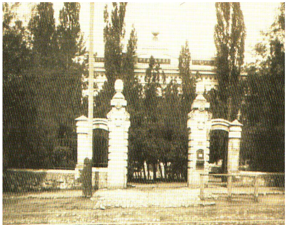
Єлисаветградське земське реальне училище, брама, фото поч. XX ст.

Наприкінці 1890-х рр. земство здійснює давній задум побудувати при училищі пансіон для учнів та «домову» церкву. У 1893 році земство доручило земському інженеру Г. Шостовському складання проекту й кошторису будинку пансіону. Наступного року Одеському відділенню імператорського російського технічного товариства були представлені плани й кошторис будівництва пансіону на 100 осіб. У 1898 році було розпочато будівництво прибудови для пансіону в північному торці північно-східного фасаду.