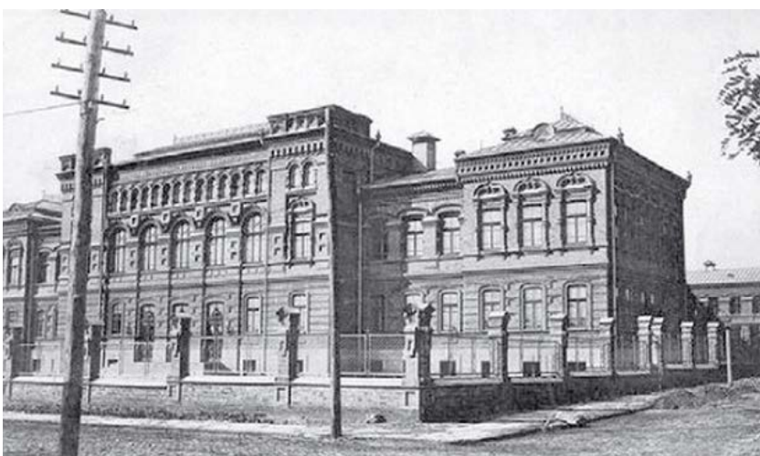
Єлисаветградська громадська жіноча гімназія

Перша велика робота Олександра Лишневського у Єлисаветграді пов'язана з Жіночою гімназією (нині – головний корпус Кіровоградського державного педагогічного університету імені Володимира Винниченка), побудованої у «цегляному стилі», широко поширеному у 1880 – 1890-х роках через економічність будівництва. У цій будівлі прослідковується тяжіння архітектора до неовізантійських форм декорування фасаду у поєднанні з елементами ренесансного декору при кладці стін із застосуванням фасонної цеглини.