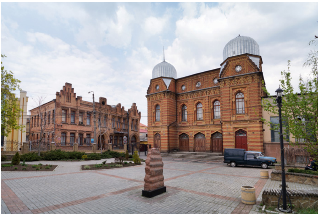
Кіровоградська Велика хоральна синагога

Єлисаветградська Велика синагога належить до видатної спадщини архітектурної школи еклектики в Україні.