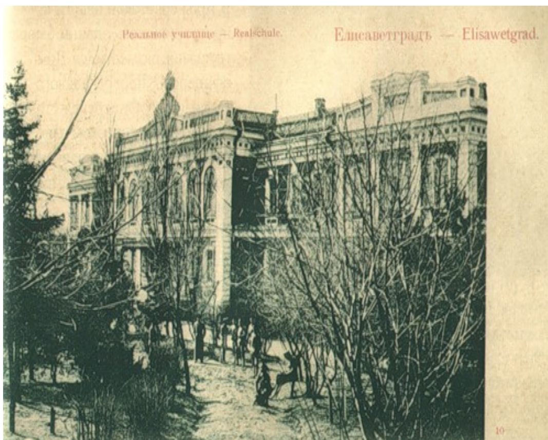
Єлисаветградське земське реальне училище

Будівництвом прибудови й домової церкви керував міський архітектор О. Л. Лишневський. Паркет для настилення підлог в прибудові поставлявся з м. Одеси (паркетна фабрика Духовського). Настилення паркету виконав майстер Мулевін. Майстер ліпних робіт Кравицький виконав роботи з ліплення для оздоблення церкви. Майстер Петренко виготовив хрест для церкви, майстер Запорожченко позолотив його, а майстер Мухін вставив дзеркальне скло. Цинкове покриття купола на церкві виконав майстер Бендюг. Архітектор Лишневський виконав проект іконостасу.