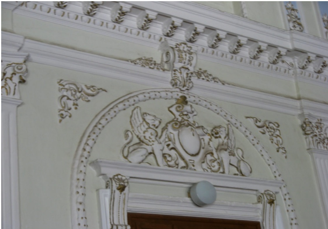
Громадська жіноча гімназія

Таких пунктів було дев'ять: 1) парадні двері до вестибюлю не мали захисних від протягів тамбурів; 2) не було перегородок із дверима (які б також унеможлилювали протяг) між нижнім коридором і парадними сходами, які вели на II поверх; 3) відсутня перегородка між коридором біля їдальні та іншою його частиною; 4) сирість приміщення для обслуговуючого персоналу; 5) потреба огороження будинку, хоча б тимчасовим на перших порах, парканом і наведення санітарного порядку на подвір'ї, щоб його частина могла слугувати для прогулянок учениць; 6) необхідність приведення в порядок вулиці для проходу учителів і учнів до приміщення; 7) перевірити фахівцями ступінь сирості і вентиляції будинку відповідними приладами; 8) усунути недоліки (зокрема, огородити перилами всі сходи), які могли викликати нещасні випадки; 9) влаштувати помийну яму і встановити ящик для сміття згідно із загальними санітарними правилами.