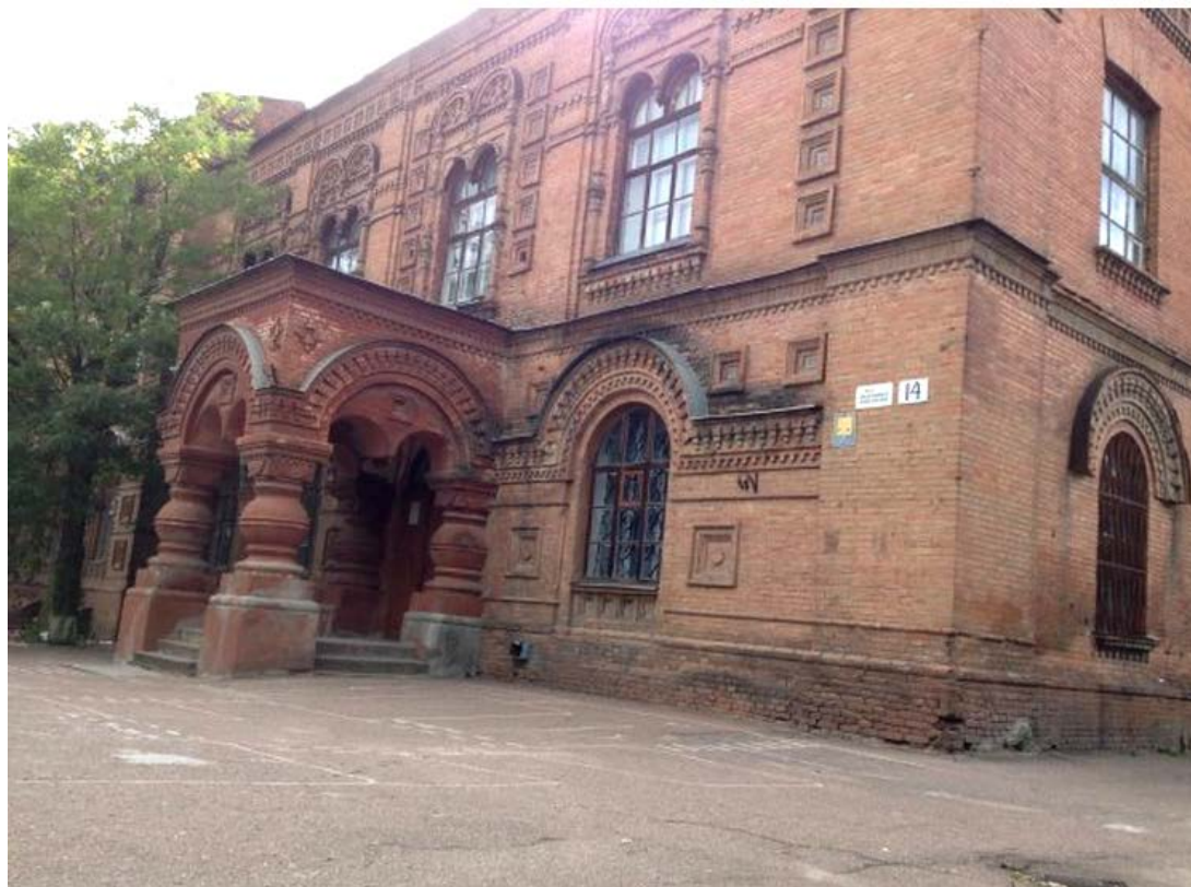
Ремісничо-грамотне училище у Кіровограді