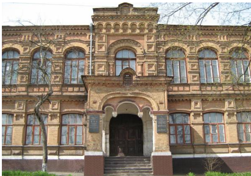
Пушкінське училище, сьогодні загальноосвітня школа I-III ступенів № 7 ім. О. С. Пушкіна Кіровоградської міської ради Кіровоградської області