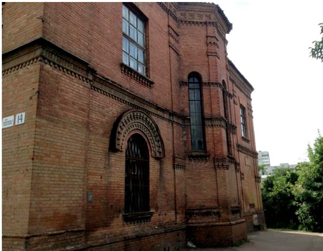
Ремісничо-грамотне училище у Кіровограді