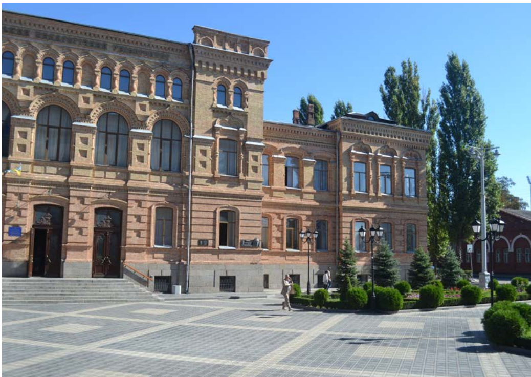
Кіровоградський державний педагогічний університет імені Володимира Винниченка