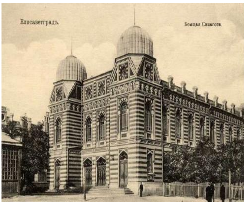
Єлисаветградська Велика хоральна синагога

Якщо вірити архівним документам про вилучення церковних цінностей, то у 1922 році в Єлисаветграді налічувалося 14 синагог! Ось їх назви: Головна, Хоральна, Пермська, Куцівська, Нижньо-Биківська, Кравецька, Малярна, Литовська, Біла, Червона, Синя, Бесгамедрін, Хоівенціон та Нейше-Гаміта. На превелике розчарування конфіскаторів, які розпочали вилучення саме із синагог,