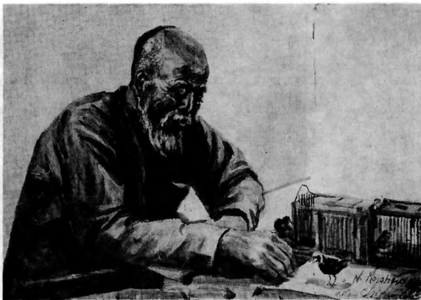
Птицелов (акварель; автор – Н.Л. Кошевский).

же портрет самой красивой девушки Дайрена. Местная пресса восторженно отмечала успех выставки, о ней сообщалось и в харбинской печати: «Выставка картин худ. Н.Л. Кошевского очень красочна. Есть такие ценные полотна, как портрет Бетховена, портрет жены художника, чудесная картина, похожая на акварель, изображающая малолетнюю дочь художника и т.д. Красочны пейзажи Пекина и его окрестностей – среди них есть несколько очень сильных картин. Запоминается "Истина" – с лицом Христа, картина на сюжет ночного предгрозового моря... Перечислить все удачные полотна трудно. Среди них занимают (чуть ли не одно из первых мест) замечательные портреты китайцев – они настолько выпуклы и талантливы, что некоторые из них хочется назвать шедеврами» (Заря 1940а). Автор заметки, отмечая особую работоспособность и основательную школу художника, обратил внимание на то, что у "Н.Л. Кошевского есть ко всему этому и то, чему научиться нельзя, а с чем нужно родиться – у него большое художественное дарование и чутье, и ему есть что сказать красками" (Там же).