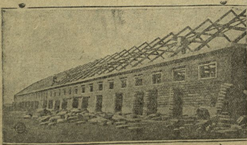
НА СНИМКЕ: В колхозе заканчивается постройка свинарника на 60 ваток.