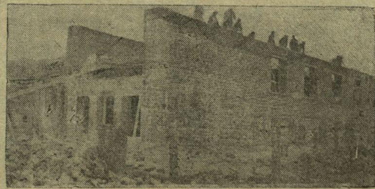
Постройка школы. г. Чебоксары.