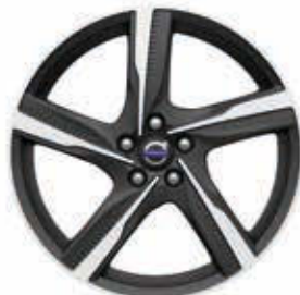
Ixion II 8,0 x 20"