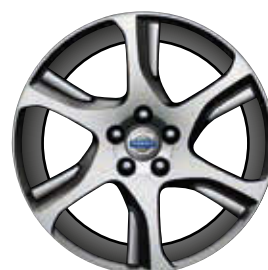
Zephyrus 7,5 x 18"