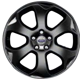
Merac Schwarz 7,5 x 18"