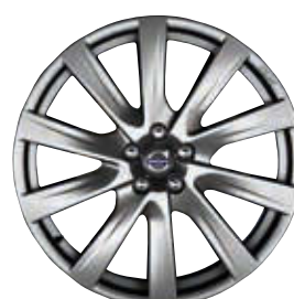
Avior 8,0 x 20"