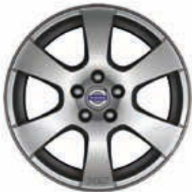
Segin 7,5 x 17"