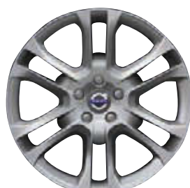
Pan 7,5 x 18"