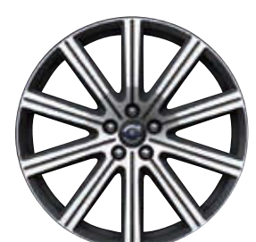
Titania 8,0 x 20"