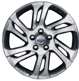
Valder 7,5 x 17"