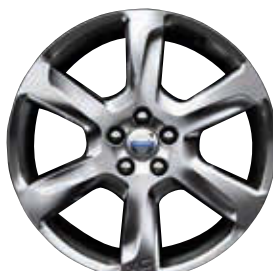
Fenrir 7,5 x 19"