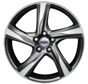
Ixion 8,0 x 18"