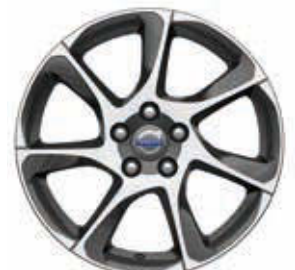
Portunus 8,0 x 18"