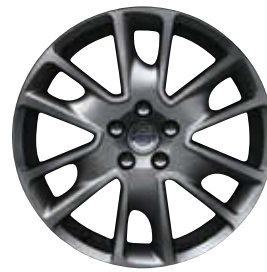
Freja 7,5 x 18"