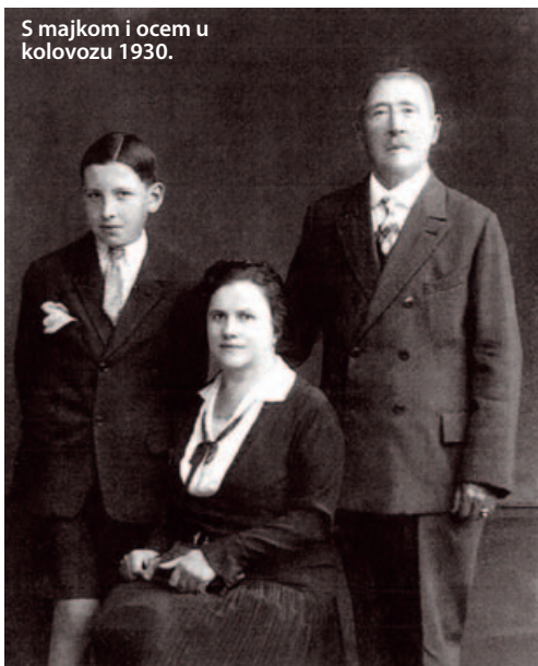
S majkom i ocem u kolovozu 1930.