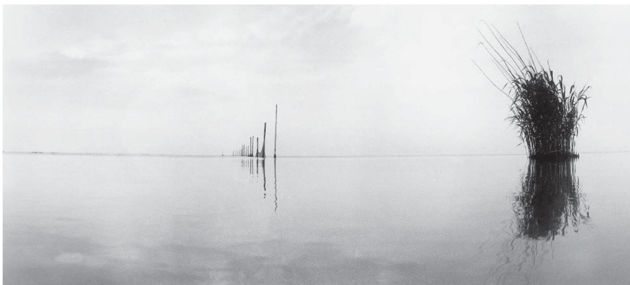
Jezioro Łebskie 1985