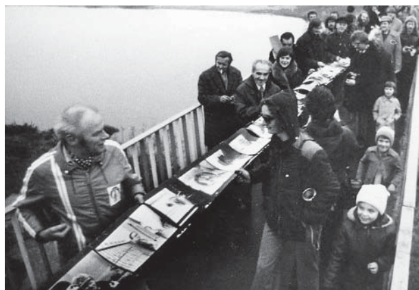
Grupa ZBLIŻENIE, „Akcja Most” – Sympozjum Uniejów 1976