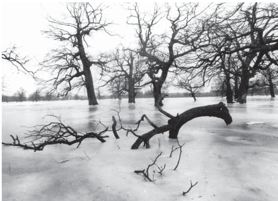
Diaporama „Bitwa na lodowym polu”, 1982