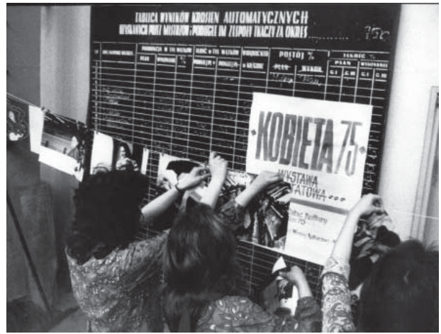
Warsztaty Fotograficzne „Wistyl”, Kalisz 1975