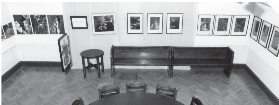
Galeria Fotografii „pf”

Adam Sobota Galeria Fotografii „pf”, IMAGO, Nr 9