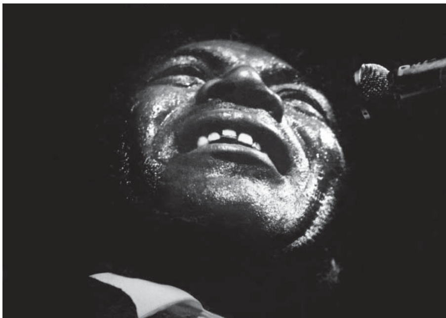
Howlin Wolf 1964