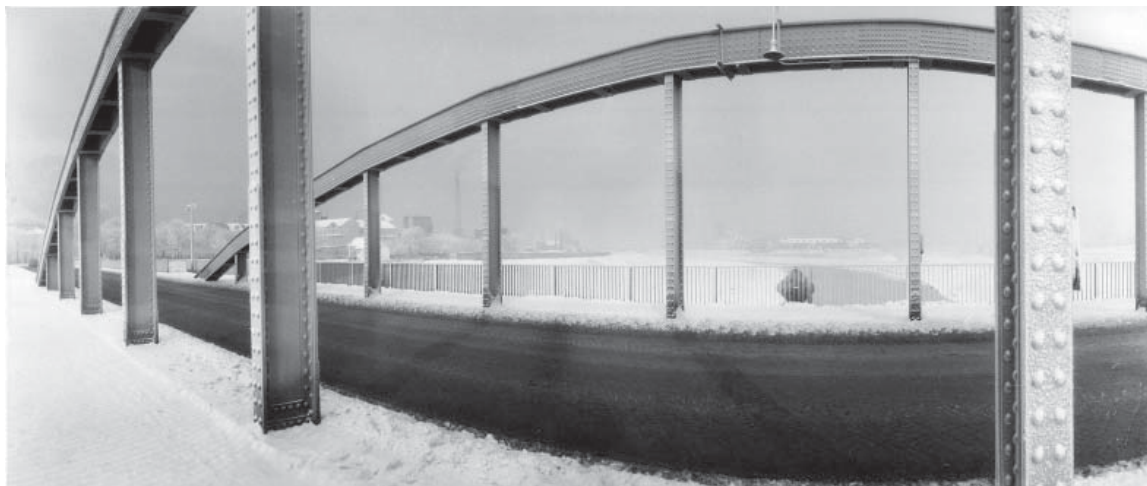
Poznań - Most św. Rocha