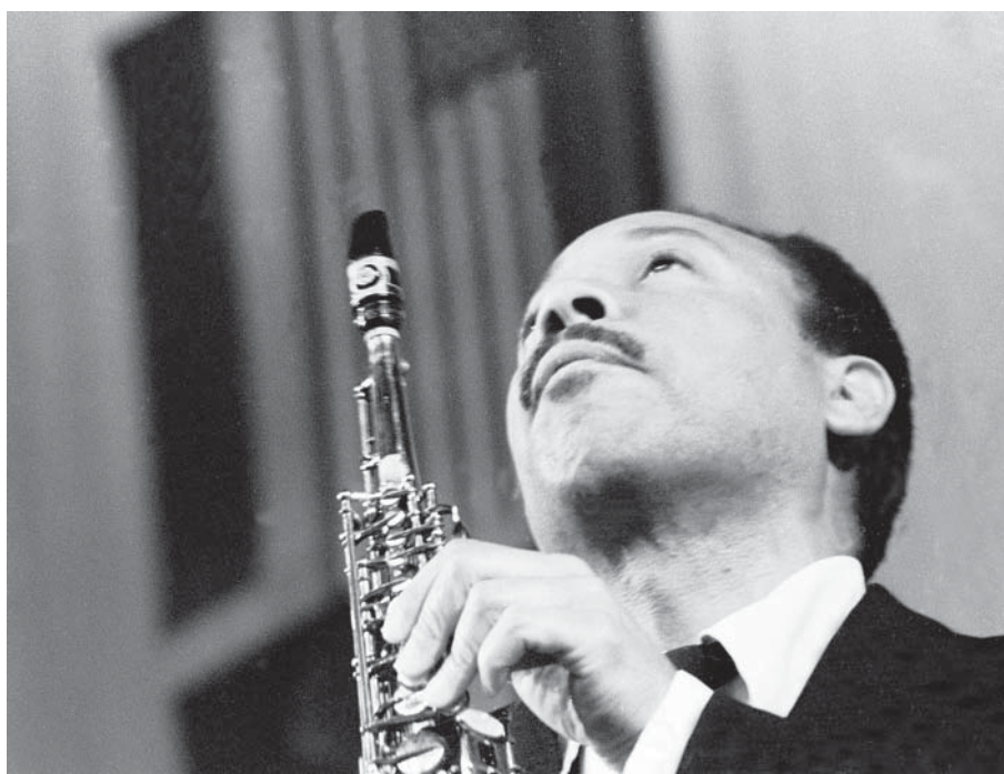
Lou Donaldson 1969

U Janusza Nowackiego to nie tania ekspresja fizyczności ludzi jazzu, ale dojrzała świadomość psychologicznego portretu człowieka. Nie znaczy to, że nie słyszymy muzyki. Słyszemy ją i dotykamy w sposób bardzo szczególny. Co ważne, oglądając portrety jazzowe Nowackiego, nie czuję upływu tych kilkadziesiąt lat od momentu, kiedy powstały.