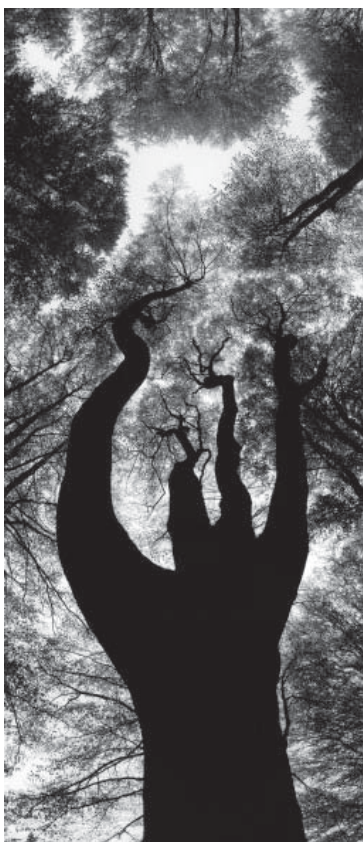
„Pod kopułą lasu” 1984-1985