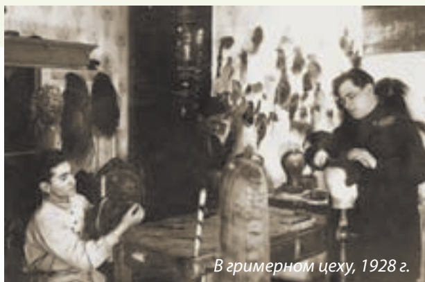
В гримерном цеху, 1928 г.