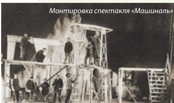
Монтировка спектакля «Машиналь»

ской сцены XVI века, новая сцена БРТ была разделена на 5 частей: средняя - во всю высоту сценической коробки и две по бокам, расчлененные в свою очередь на 2 яруса – верхний и нижний. Это позволяло совершенствовать динамику действия, разворачивая их параллельно на всех площадках.