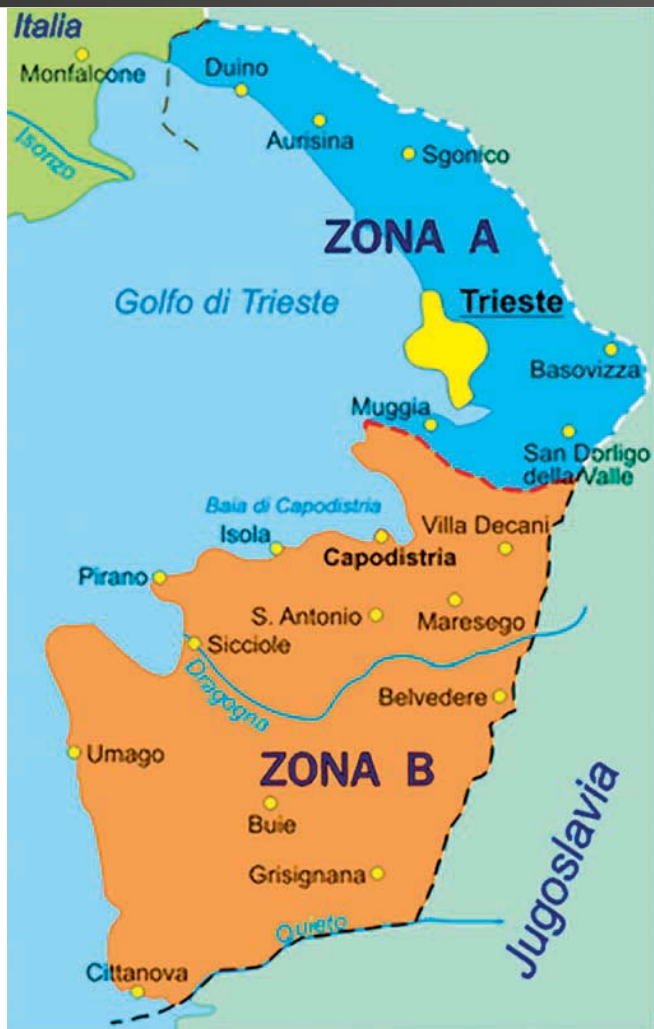
Слободна територија Трст