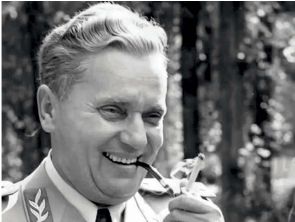
Јосип Броз Тито

Односи унутар савезничке коалиције и развој догађаја на ратиштима у Европи, пре свега на њеном југоистоку, као и информације које су из Југославије слали представници британских војних мисија и извештаји британског амбасадора при југословенској влади у Лондону непосредно су определили основе нове британске политике према Југославији, дефинисане као „политика компромиса“. Према замисли британског премијера Винстона Черчила, креатора ове политике, комунисти и умерене грађанске снаге у земљи, које су институционално представљали Национални комитет ослобођења Југославије (формиран на Другом заседању АВНОЈ-а крајем 1943) и југословенска влада у Лондону, требало је да остваре договор око поделе власти у земљи и формирају заједничку Привремену владу, а на међународном плану, ова политика подразумевала је компромис између двеју великих сила, Велике Британије и СССР, око поделе политичког утицаја у Југославији.