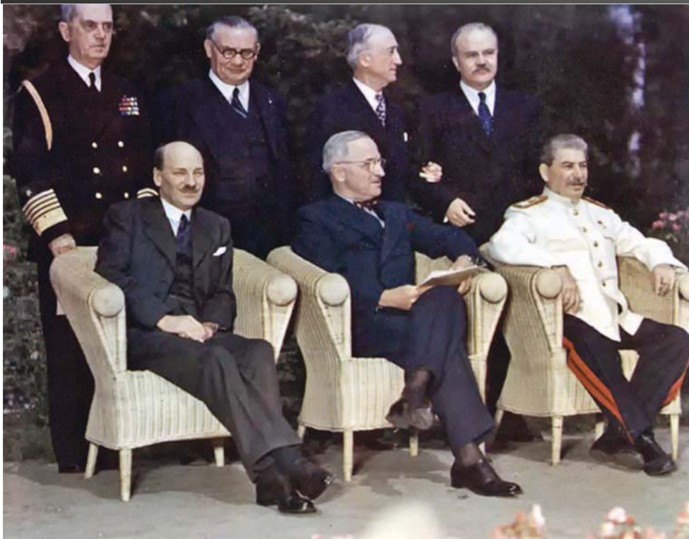
Конференције у Поздому, одржана од 17. јула до 2. августа 1945. године

Југословенско-италијанског спора следили су увелико блокловску логику. Министри Велике Британије, Француске и САД сматрали су да Трст треба да припадне Италији, док је Молотов тврдио да треба да припадне Југославији. Састанку су присуствовали и представници Југославије и Италије, Едвард Кардељ и Алџиде де Гаспери, који су 15. септембра образложили ставове својих влада. Кардељ је захтевао да читаву територију Јулијске крајине, као економска и територијална целина, припадне Југославији, с обзиром на то да у овој области већинско словеначко и хрватско становништво чини компактну масу, док Италијани живе искључиво у градовима, и то пре свега у Трсту. Трст би, по југословенском предлогу, добио статус федералне јединице у оквиру ДФЈ, док би тршћанска лука имала статус слободног пристаништа. Де Гаспери је у свом излагању тврдио да су Горица и Трст италијански градови и да је стога неопходно да и њихово залеђе припадне Италији. Он је захтевао да италијанско-југословенска граница следи демаркацију коју је предложио Вудро Вилсон после Првог светског рата. Прихватио је да тршћанска лука, али не и град Трст, добије међународни статус, а да Ријека припадне Југославији, под условом да добије аутономију.