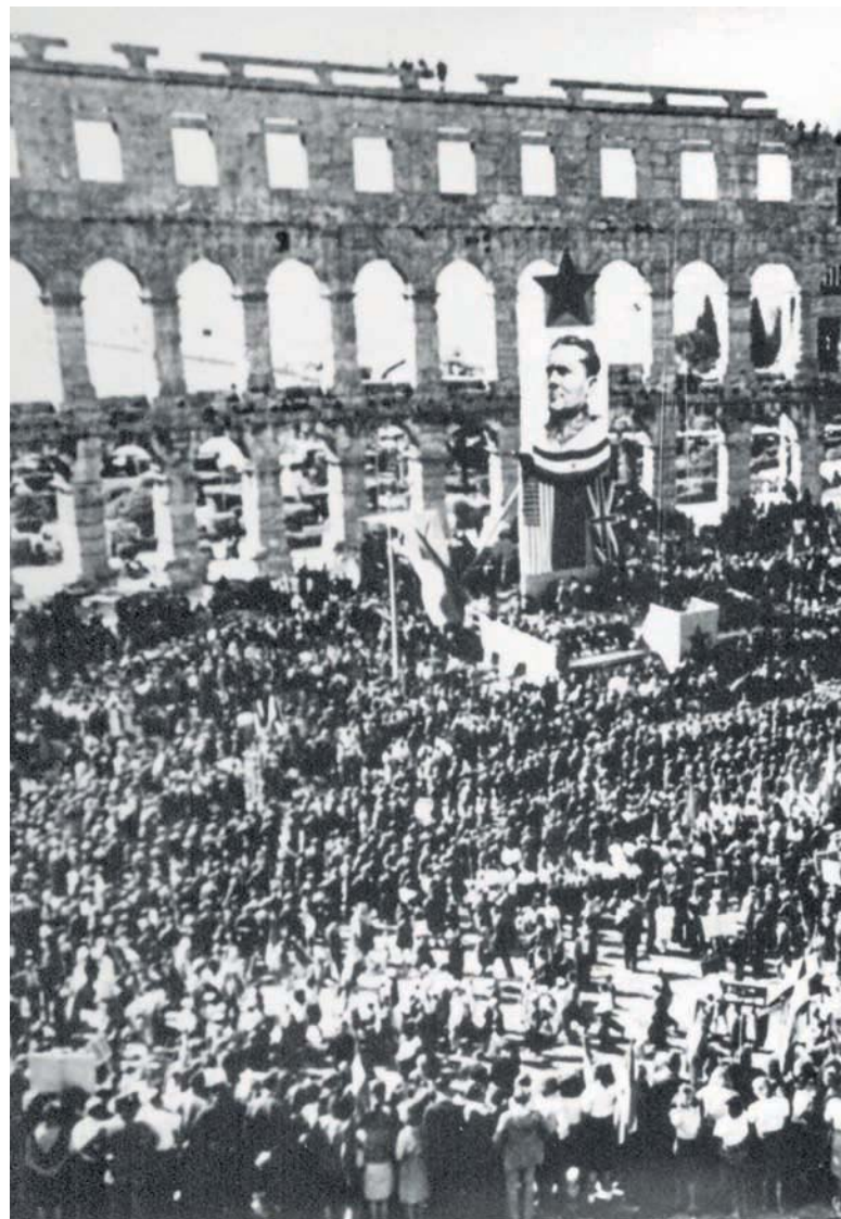
Прослава Дана њобеге у Пули, 1945. године

Након почетних излагања југословенских и италијанских представника, Савет министара окренуо се изради статута СТТ, па је главна дебата вођена око надлежности будућег гувернера, о вођењу спољне политике која је била у рукама гувернера, о питањима јавне безбедности, носиоцима судијских функција, хијерархији власти, о војном присуству на подручју СТТ, о режиму у слободној луци Трста и другим важним питањима. Прве дебате Савета о овим питањима биле су тешке и неизвесне, претећи чак да доведу до парализе рада овог тела и краха читавог мировног процеса.