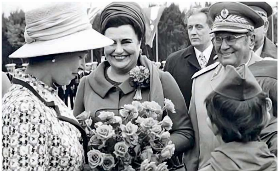
Југословенски лидер добио је шансу да ошћочне са личним поозиционирањем на глобалној свејској позорници – Тишо и Јованка Броз дочекују краљицу Елизабету

Ситуација у Јулијској крајини приморала је администрацију председника Трумана да посвети сву пажњу односима са Југославијом. Због агресивне југословенске политике у овој покрајини, Труман је био приморан да наруши нека од начела на којима се темељила америчка спољна политика: да се америчке трупе не користе за решавање политичких сукоба на Балкану и да се територијални спорови не могу решавати силом, већ само на мировној конференцији. Стејт департмент је од самог почетка спора око Јулијске крајине заузео став да савезници морају управљати целом територијом покрајине, али је, суочен са напредовањем југословенске Четврте армије, био приморан да прихвати да се савезничка управа уведе само у њеном западном делу. И овај половични успех постигнут је тек пошто је