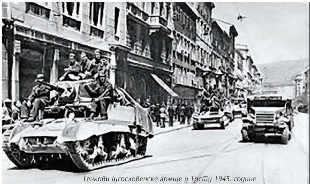
Тенкови Југословенске армије у Трсту 1945. године

Улазак југословенских трупа у Трст изазвао је велику узнемиреност и у Ватикану, који је подржавао италијанске интересе и залагао се за очување предратних граница Италије. У току наредних месеци Ватикан није пропуштао прилику да упозори на стање у Трсту и Јулијској крајини, на страх који је створила комунистичка власт, на терор, убиства, прогоне италијанских војника и цивила, свештенства и верника. „Расположење против партизана се све више погоршавало”, јављао је генерал Александер. „У самом Тр-