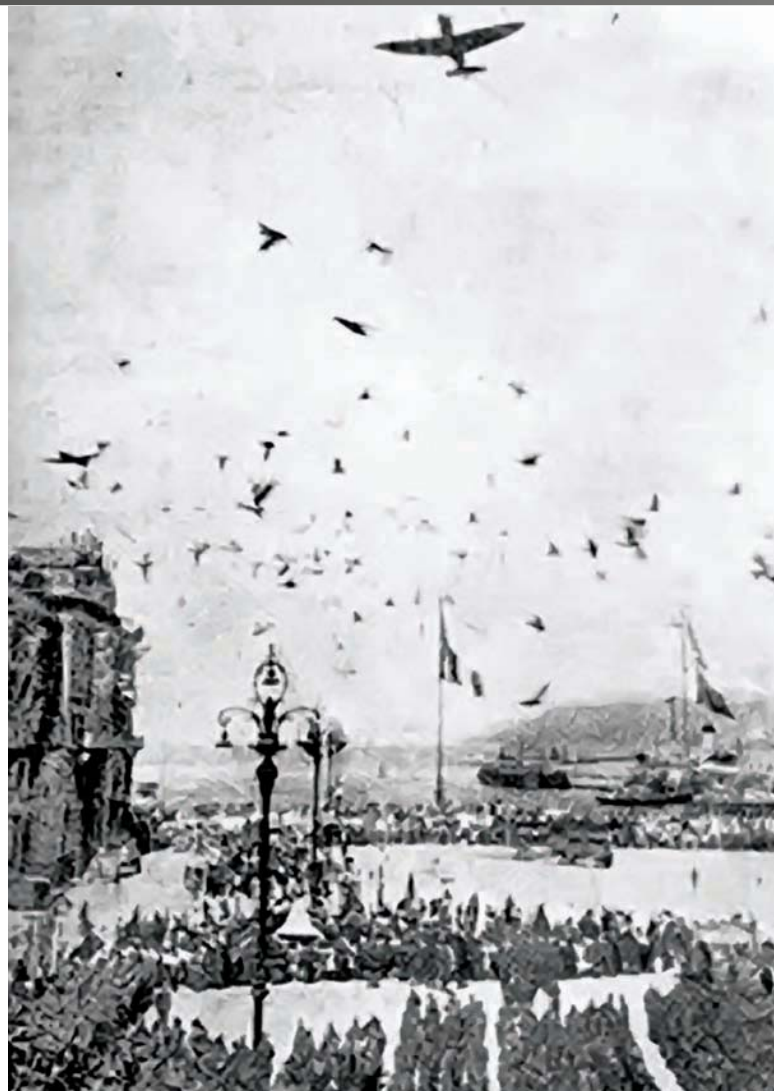
Парада Југословенске армије у ослобођеном Трсту

„Дипломатски рат“ између југословенске владе и влада западних сила око Јулијске крајине достигао је врхунац средином маја 1945. године. Тада су југословенској влади уручене две идентичне ноте из Лондона и Вашингтона у којима се захтевало да Југословени прихвате савезничку војну управу у Пули, Трсту, Горици и Монфалконеу, као и на територији источно од пруге Трст–Тржич и да нареду својим јединицама да сарађују са савезничком управом у наведеним областима. Истовремено, југословенској влади пружена су уверавања да увођење савезничке војне управе неће утицати на коначну одлуку о њеним захтевима за територијалним проширењем. Током расправе у Стејт департменту тих дана појавила се и идеја да се, уколико Броз одбаци америчку ноту, затражи од совјетске владе да на њега изврши притисак.