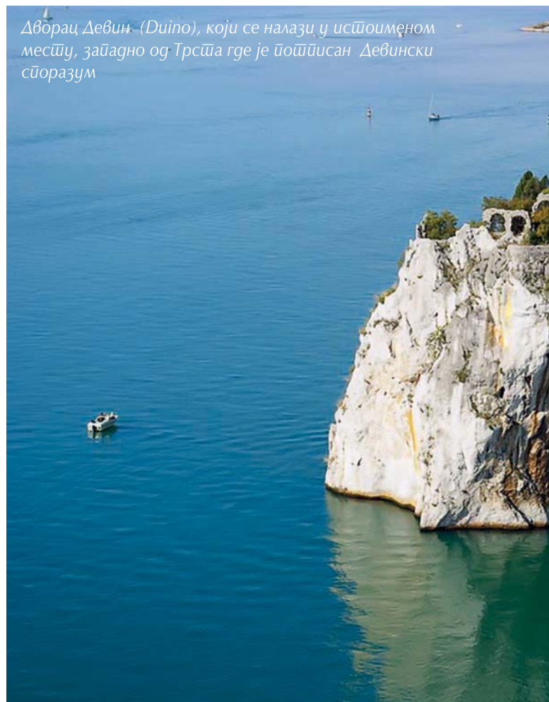
Дворец Девин (Duino), који се налази у истоименом месту, западно од Трста где је потписан Девински споразум

Након потписивања Девинског споразума, југословенска влада и даље је настојала да се избори за опстанак својих цивилних органа у савезничком делу Јулијске крајине, у складу са тачком 3. Београдског споразума у којој је, између осталог, стајало да ће се употребити „сва она југословенска управа која је већ успостављена, а која, по мишљењу савезничког врховног команданта, ради задовољавајуће”. Међутим, у истој тачки такође је писало да ће „савезничка војна управа бити овлашћена да употреби било које цивилне власти које сматра за најбоље у појединим местима, као и да мења административно особље по свом нахођењу”. Узалуд се Југословенска новинска агенција „Танјуг” позивала на ову тачку и критиковала увођење италијанског