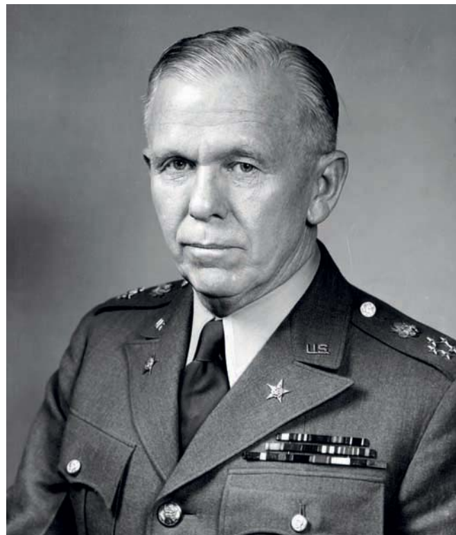
Генерал Џорџ Маршал. државни секретар САД

Борба између СССР-а и САД постајала је све бескомпромиснија. Москва и Вашингтон доживљавали су своју улогу као мисију која је имала за циљ наметање сопствених вредности другима, по моделу – оно што је за њих добро, добро је и осталима. Стога нису презали ни од интервенционизма, који није увек значао и војну акцију. Већина европских држава следила је америчко и совјетско лидерство, поштовала њихове препоруке или попуштала пред њиховим притисцима. На другој страни, ван Европе, у Африци и Азији одвијао се процес деколонизације, из којег је настајао велики број нових држава. Њима су се од самог почетка нудила два модела развоја – амерички демократски и совјетски комунистички. Обе силе су у томе виделе могућност ширења сопственог утицаја, који није био само идеолошке и политичке природе, већ је, пре свега, подразумевао економске и стратешке интересе, посебно у регионима