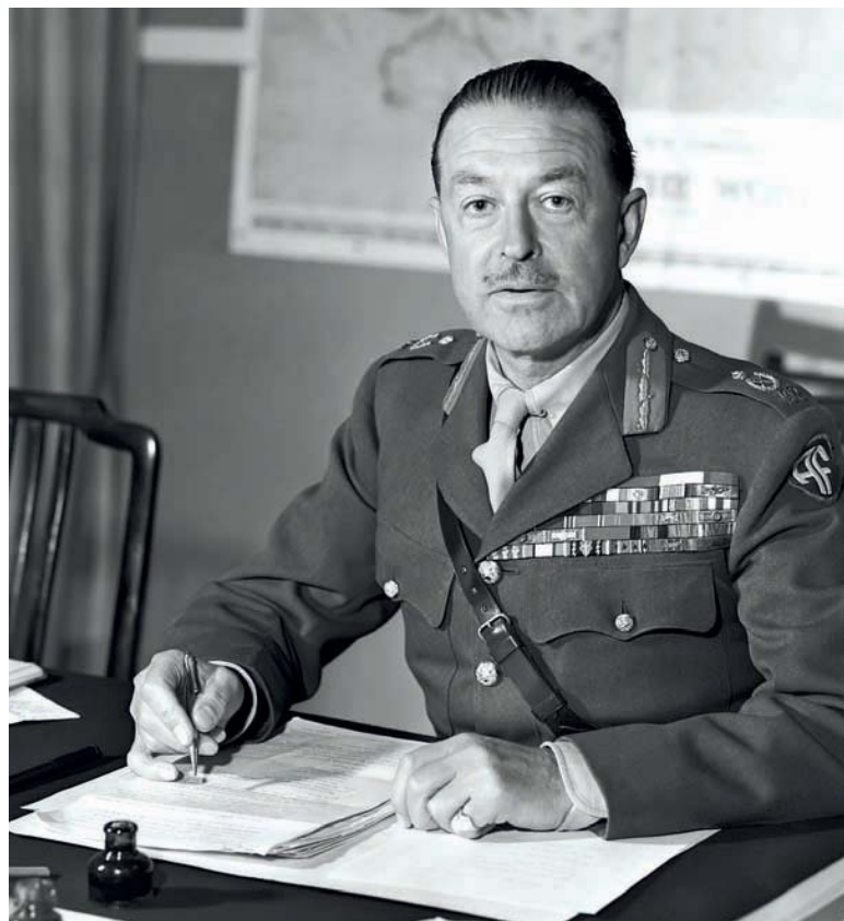
Врховни командант савезничких снага на Медитерану фелдмаршал Харолд Александер

Још од почетка рата САД су пажљиво пратиле кампању коју су водили југословенска влада у Лондону и комунистичко вођство у земљи по питању ревизије северозападних граница Југославије. Броз је користио сваку прилику да пред британским званичницима наметне питање судбине Јулијске крајине, посебно Истре и Словеначког приморја. То питање било је актуелно и током његовог разговора са Винстоном Черчилом у Напуљу 12. августа 1944. године. Америчка администрација и британска влада биле су је-