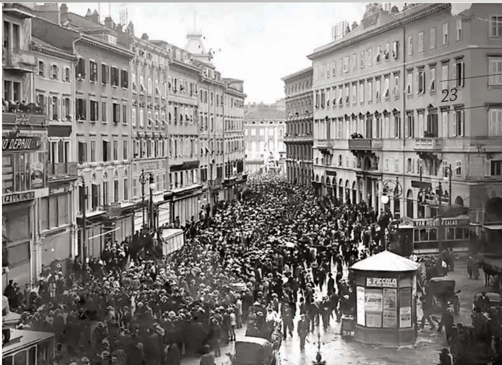
На улицама Трста

За разлику од неподељене подршке трију великих сила коју је Народноослободилачки покрет добио на Тече-