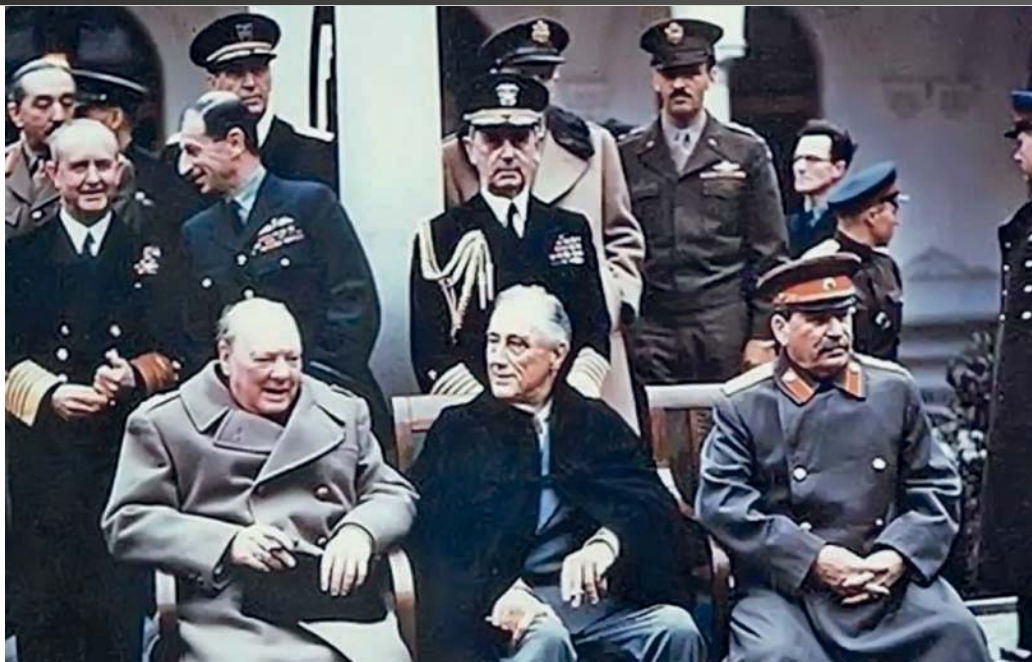
Конференција у Јалти одржана 1945. године

када српске реакције” и ставе под контролу (у изолацију) најутицајнији политички опоненти новој, комунистичкој власти. Томе у прилог говори и чињеница да су у Привременој влади ДФЈ све кључне ресурсе држали комунисти.