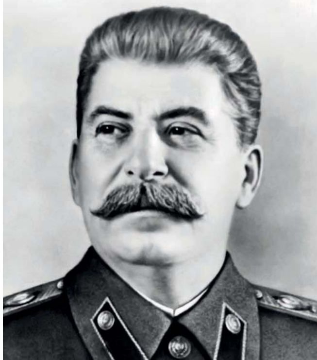
Јосиф Висарионович Стаљин

тиненте. Његов први излазак на светску сцену догодио се 1950. године, са избијањем корејске кризе.