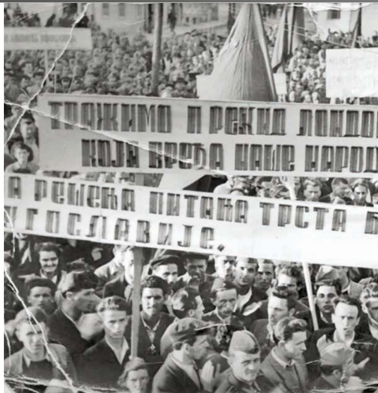
„Тражимо прекид Лондонске конференција која вређа наше народе“, писало је на транспаренту на демонстрацијама одржаним 1954. године

Мировни уговор са Италијом, потписан фебруара 1947, није решио Тршћанску кризу. Она ће трајати све до 1954. године, када се окончала 5. октобра, потписивањем Меморандума о разумевању у Лондону. Дуготрајни преговори који су настављени и после 1947. одсликавали су истовремено и односе међу заинтересованим странама, пре свега државама које су у Другом светском рату биле савезнице, а чије се савезништво нашло у великој кризи већ на