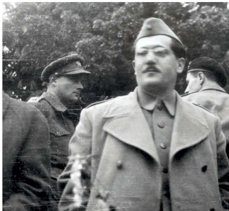
Едвард Кардељ је предводио југословенску делегацију на Мировној конференцији у Паризу, 1946. године

јим се Кремљ служи у Југославији „како би изазвао грађански рат и тако припремио терен за комунистички државни удар“. Такви ставови постали су преовлађујући већ са почетком кризе око Трста. У јавности САД доминирао је став да је Тито у догађајима око Трста наступао „уз прећутно одобрење Стаљина, или чак по његовом директном наређењу“. Захтеви око ревизије северозападних граница Југославије третирали су као „покушај СССР-а да прошири своју