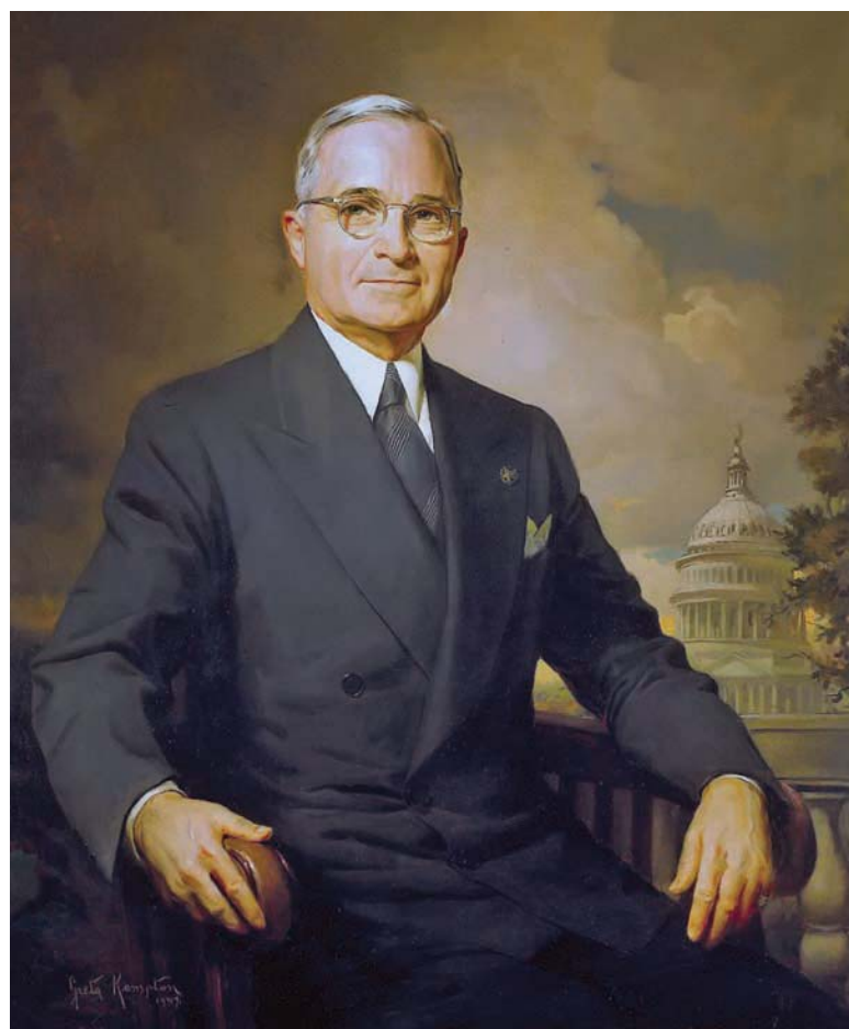
Амерички председник Хари Труман

Хладноратовско престојавање међу великим силама започело је већ по завршетку Другог светског рата, када је Совјетски Савез учврстио свој утицај у земљама Источног блока, док су Сједињене Државе започеле глобалну политику „задржавања Руса“, како би осујетиле „комунистичку инвазију“ Европе. Велика заслуга за вођење овакве полити-