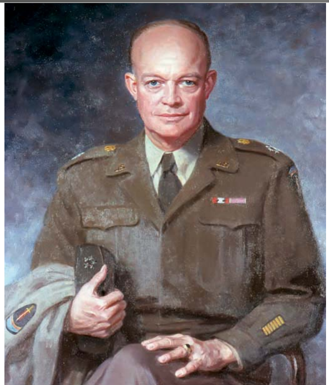
Командант савезничких снага у Европи Двајт Ајзенхауер