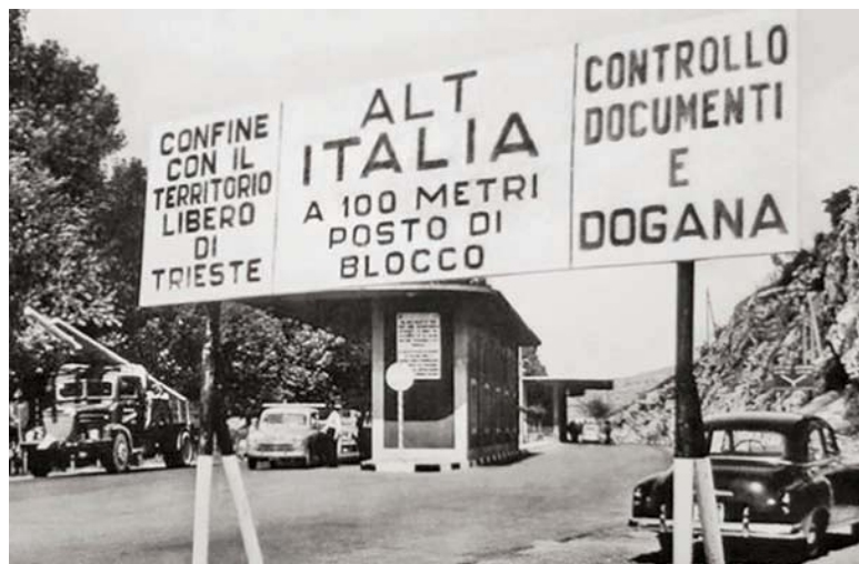
Гранични прелаз између две земље

Током новог заседања у Паризу, од 15. јуна до 15. јула 1946, Савет министара расправљао је о извештају експертске комисије. После дуге и исцрпљујуће расправе, у којој су главну реч водили британски министар Бернс и совјетски Молотов, Савет је 3. јула, у форми званичног коминикеа, јавности представио решење за Јулијску крајину. Оно се темељило на француском предлогу линије разграничења (француски предлог следио је аустријско-ита-