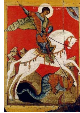
Ездец на коне

Имперскую символику династии Романовых рассмотрим в третьей части рубрики «О наведении порядка в знаках и символах».