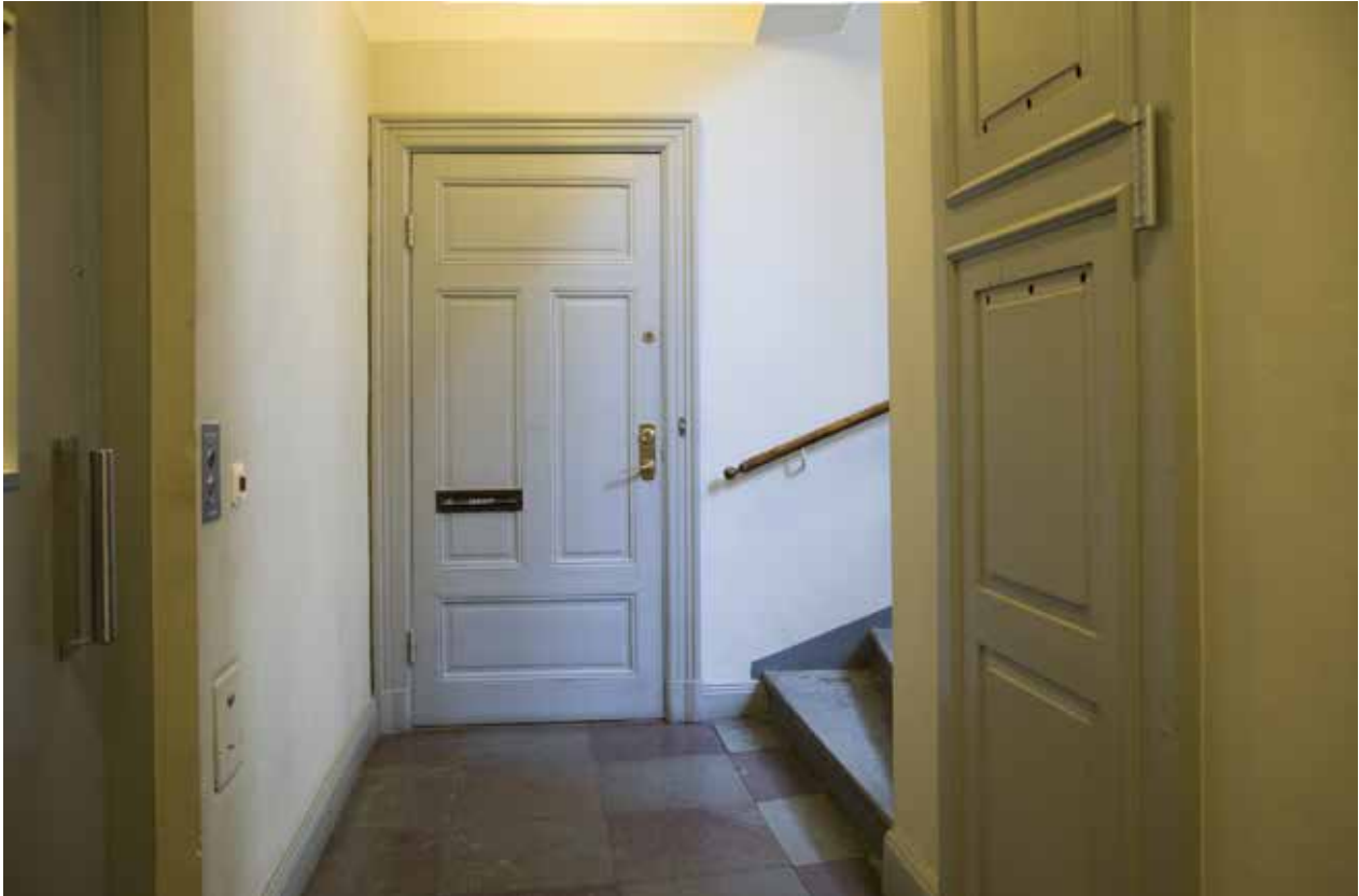
TRAPPHUS I BASTUGATAN 5. DEN FÖRE DETTA KÖKSENTRÉN UTGÖR NU LÄGENHETERNAS HUVUDENTRÉ.

Samtliga fönster, utom i en av bottenvåningens lokaler, ersattes med nya i tidstypisk utformning. Alla ytterportar, bortsett från huvudentréns pardörr och en pardörr mot Maria Trappgränd, utbyttes.