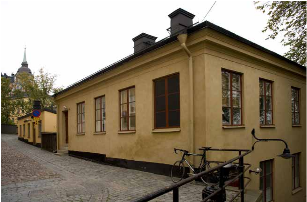
VID TAVASTGATAN STÅR GÅRDSHUSEN TILL 1700- OCH 1800-TALS BOSTADSHUSEN.

tomten. Först 1872 framträder det nuvarande huset på en kroki. Hus nummer 1 på kartan uppfördes som ett bostadshus med lägenheter för uthyrning och med verksamhetslokaler i de nedre våningsplanen. I väster sammanbyggdes det nya huset med det intilliggande 1700-talshuset, hus nummer 3–5 på kartan, som idag ingår i fastigheten.