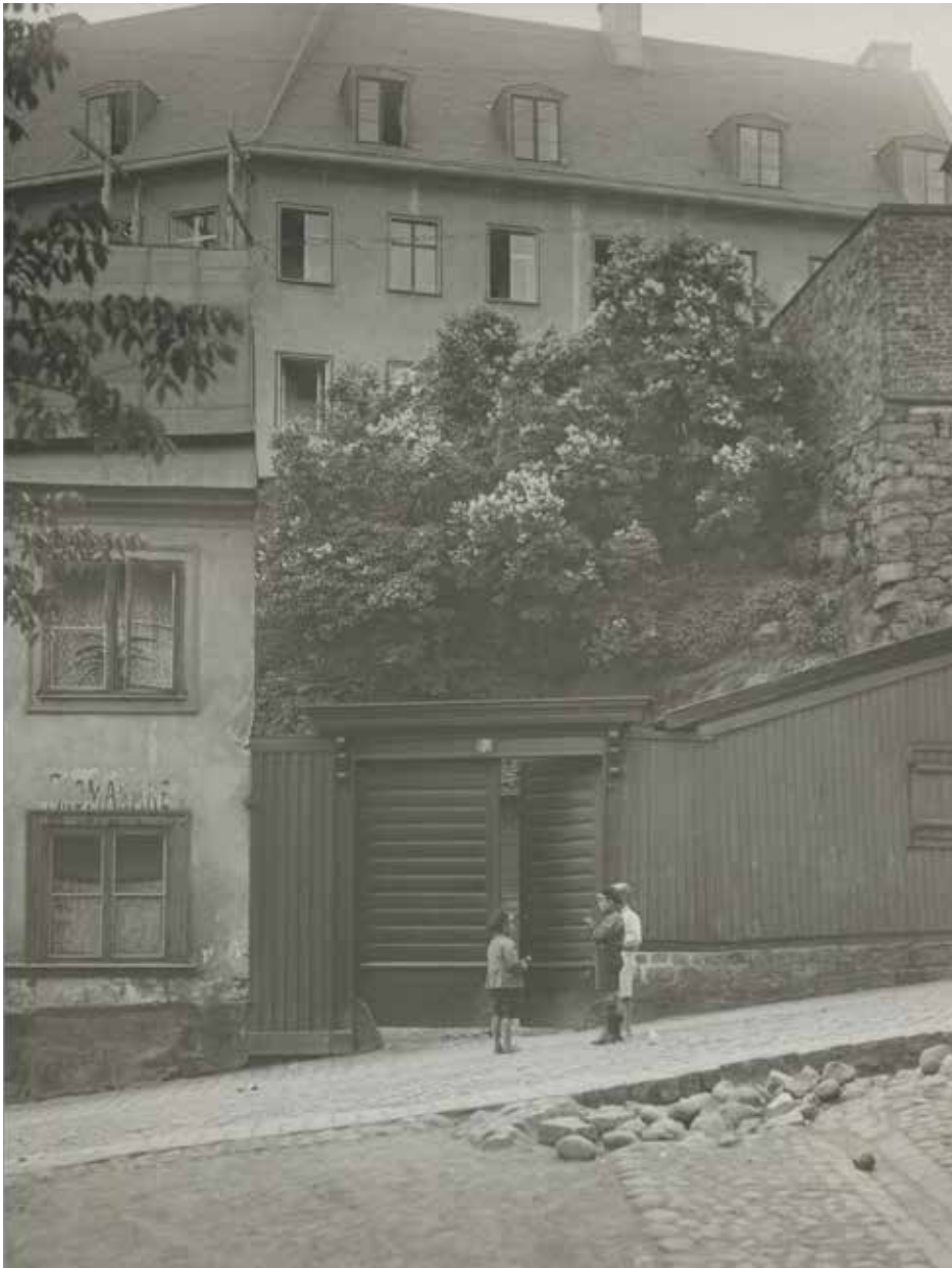
BASTUGATAN 7. OKÄNT ÅRTAL OCH FOTOGRAF. SSMFA27491.

Trappan 5 består av två äldre sammanslagna fastigheter. Den ena bebyggd med ett bostadshus från 1760-talet, den andra med ett hus från 1860–1870-talet. Byggnaderna representerar två arkitektoniska ideal och dess välbevarade och tidstypiska fasader är av stort värde för stadsbilden i en ovanligt autentisk äldre stadsmiljö.