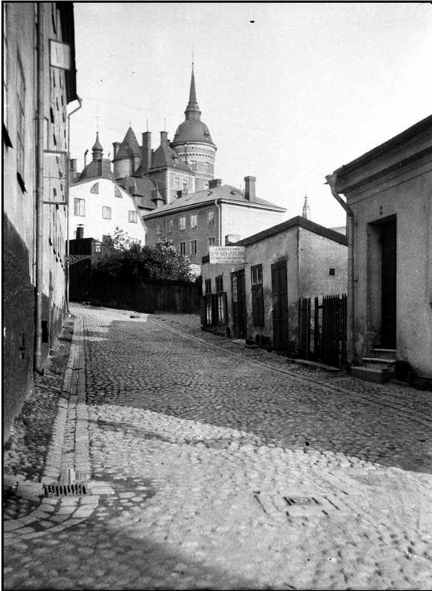
TAVASTGATAN MOT VÄSTER ÅR 1926. FOTO: D. CARLSSON. SSMFA049580S

Fastigheten står på den del av Mariaberget som påtagligt präglas av topografin med brant sluttande gator, gränder och trappor. Hela miljön, med stensatta gator, delvis med kullersten, och de bevarade husen, ger här en särskilt karaktäristisk bild av det äldre Stockholms bebyggelse och stadsliv.