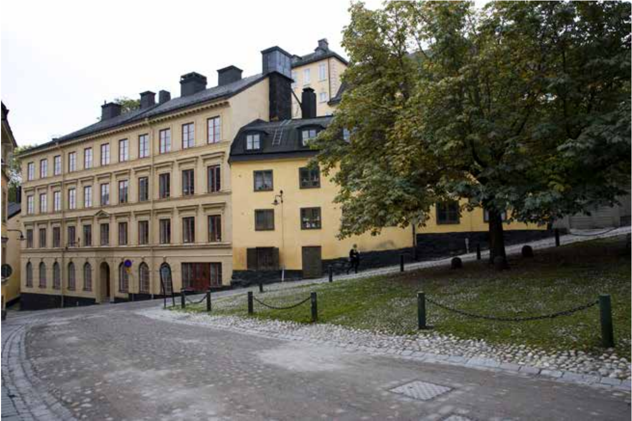
NUVARANDE FASTIGHETEN TRAPPAN 5 BESTÅR AV TVÅ ÄLDRE FASTIGHETER. Huset till vänster uppfördes under 1800-talets andra hälft, medan huset till höger uppfördes under 1700-talets andra halva.

branden. Återuppbyggnaden gjordes helt i sten och efter de regler som fanns i 1736 års byggnadsordning. Gator breddades och nya vändplatser tillskapades så att brandbekämpningen skulle bli mer effektiv. Tidens kända murmästare fick uppdrag i området och byggherrar var i många fall framgångsrika näringsidkare.