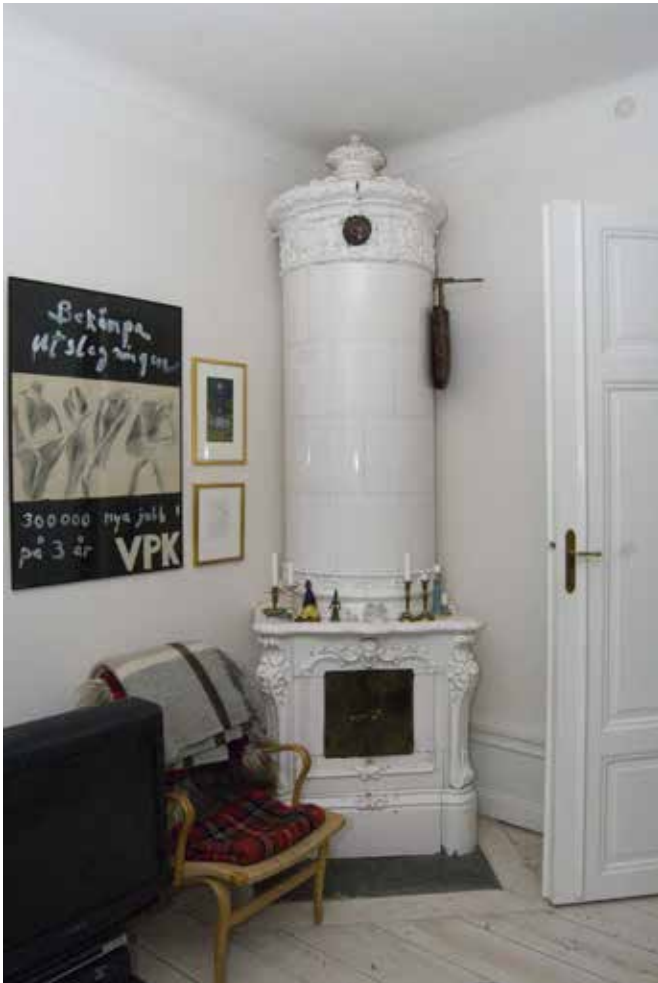
URSPRUNGLIG KAKELUGN, FOTPANEL OCH DEL AV PARDÖRR I BASTUGATAN 5.

Huvuddelen av husets fönster är från renoveringen 1970 och är rektangulära med mittpost och två spröjsade bågar. I bottenvåningen mot Bastugatan finns äldre rundbågade och spröjsade fönster som vetter in mot en lokal i bottenvåningen. De kannelrade pilastrar som ramar in före detta butikens entré kan vara från 1906.