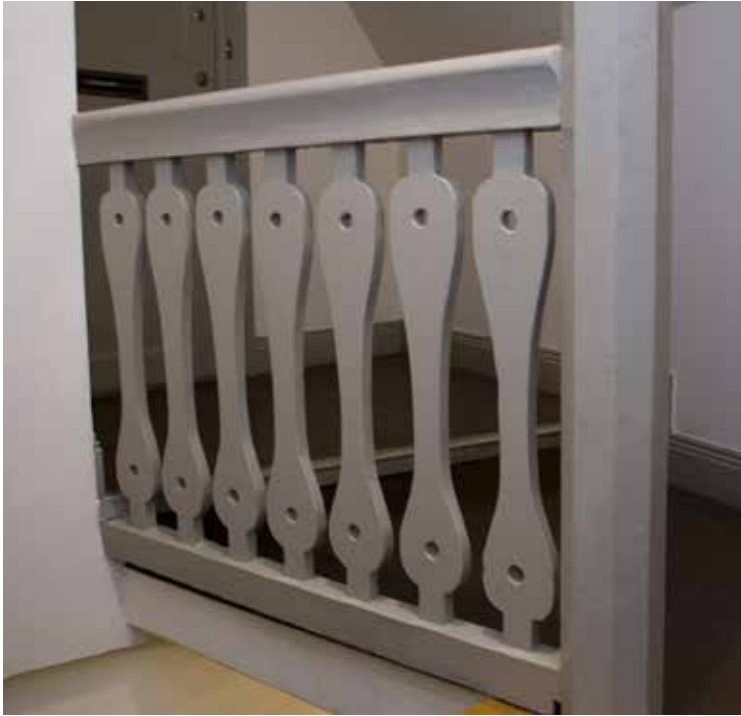
ETT AV TRAPPHUSEN I 1700-TALSBYGGNADEN BEVARAR ETT ÄLDRE DEKORATIVT RÄCKE.