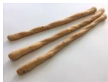
ワイン塩グリッシーニ