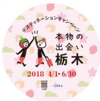
エンブレム (イメージ)