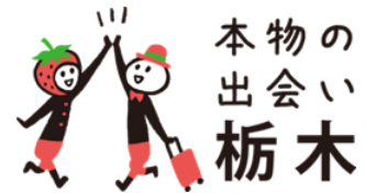
【キャンペーンロゴ】

できる、その出会いこそが「本物の出会い」です。たくさんの人に栃木県を訪れていただき、その人ならではの「本物の出会い」を見つけてほしいというメッセージを込めました。