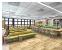
改札外待合室(イメージ)