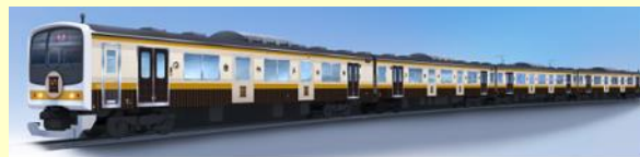
日光線「いろは」(イメージ)