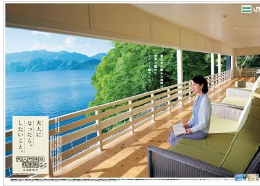
【奥日光のリゾート篇】(イメージ)