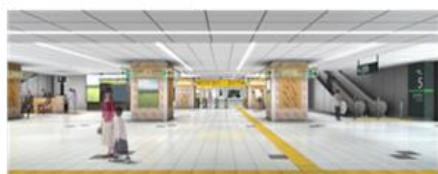
コンコース(イメージ)