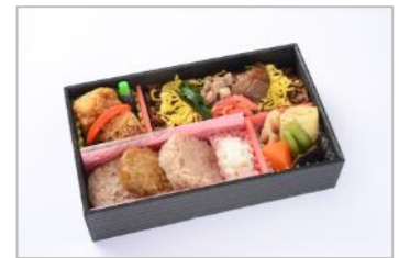
とちぎご当地グルメ弁当 (イメージ)