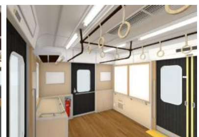
フリースペースの設置