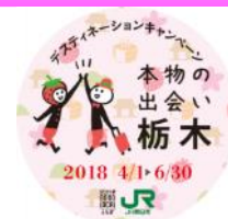
おもてなしバッジ(イメージ)

※詳細は栃木県内の主な駅に設置予定の専用チラシ（兼スタンプ台紙）をご参照ください。