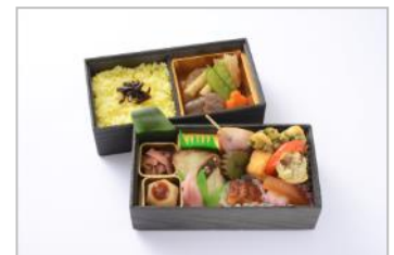
大人の休日弁当 ~とちぎ江戸料理~ (イメージ)