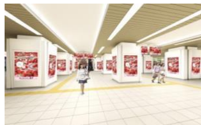
東武鉄道 池袋駅サイネージピラー(イメージ)