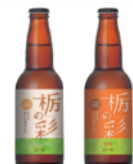
栃の彩 (とちのいろどり)

※6次産業化とは…農業をはじめとした第1次産業を、食品加工などの第2次産業、流通・販売といった第3次産業に繋げ、より競争力のある魅力的な産業にしていくこと。