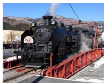
ヘッドマーク (イメージ)