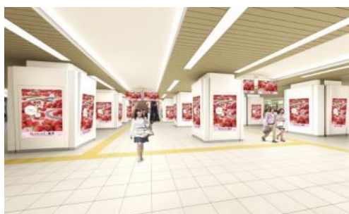
東武鉄道 池袋駅サイネージピラー (イメージ)

3月5日(月)～3月11日(日)池袋駅地下中央コンコースに設置してある池袋サイネージピラーにて放映します。