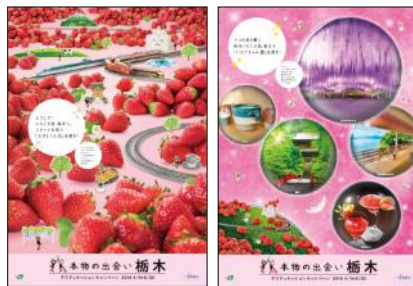
共通ポスター(イメージ)

キャンペーンロゴに使用されている「いちごちゃん」と「たびとくん」を使用した栃木DCポスターを両社で制作し、両社の主な駅に掲出して栃木DCをPRします。