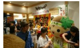
とちまるショップ（イメージ）