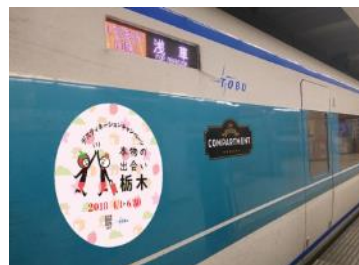
エンブレム (イメージ)