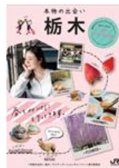
【キャンペーンガイドブック】