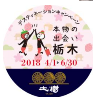
SL「大樹」ヘッドマーク (イメージ)