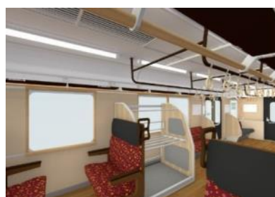
大型荷物置き場の設置