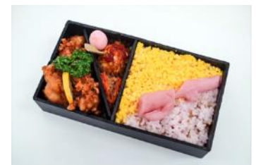
岩下の新生姜とりめし (イメージ)

販売箇所 : 宇都宮駅 在来線改札内 松酒家駅弁売店、 岩下の新生姜ミュージアム (土日祝のみ)