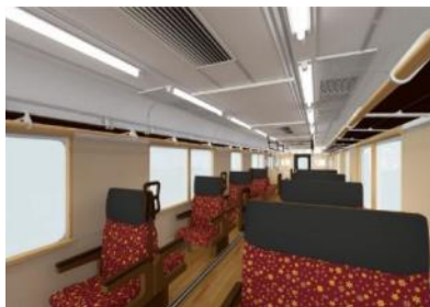
快適な大型クロスシート