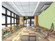
新幹線待合室(イメージ)