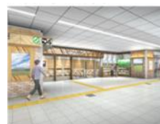
観光案内所(イメージ)