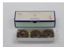
バイクドチョコレートズン