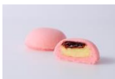
御用邸の月 完熟とちおとめ